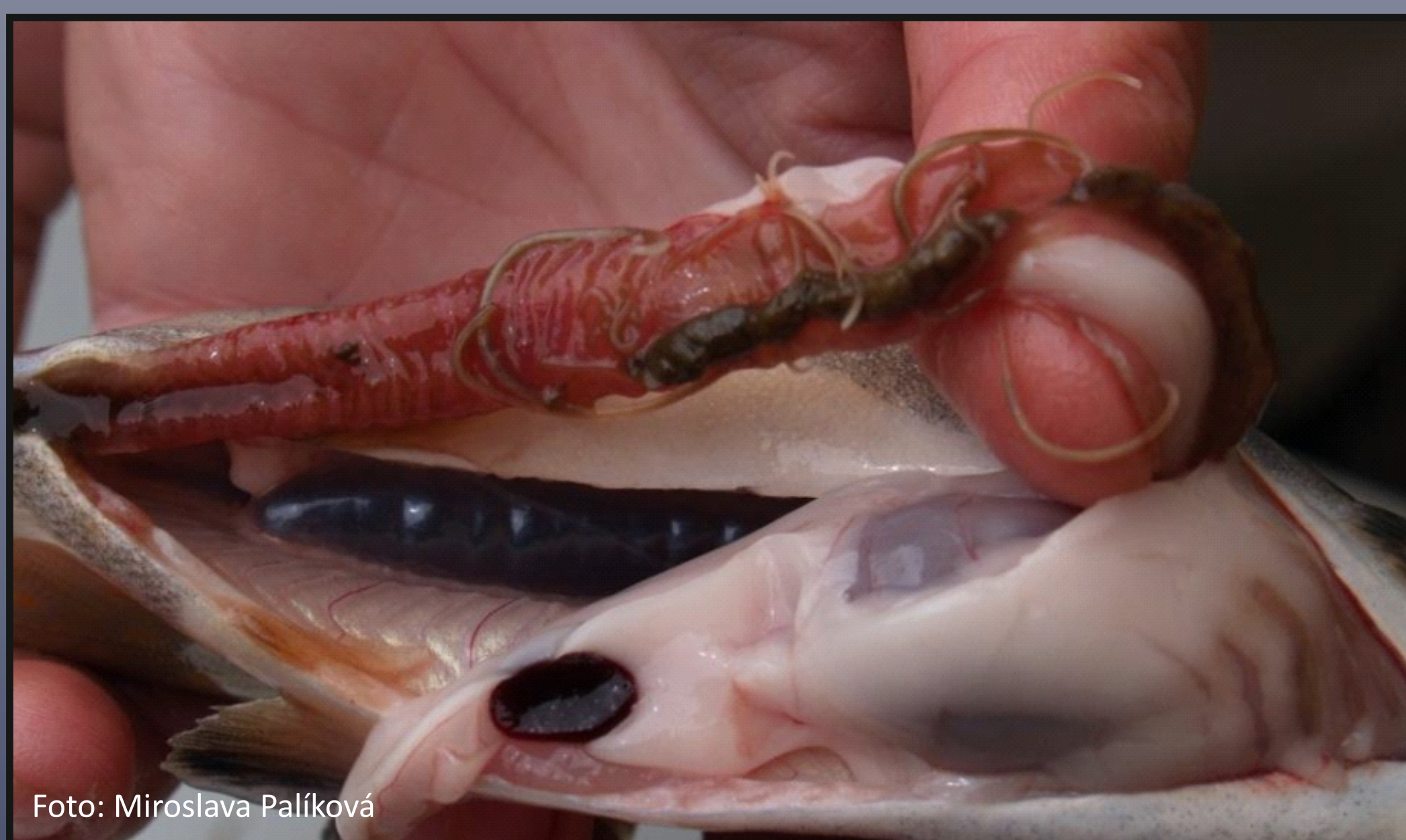
Obr. 1. Raphidascaris acus - dospělci