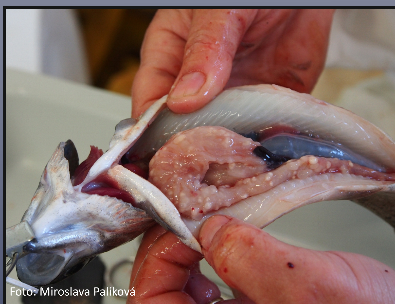
Obr. 2. R. acus - kapsuly ve střevě