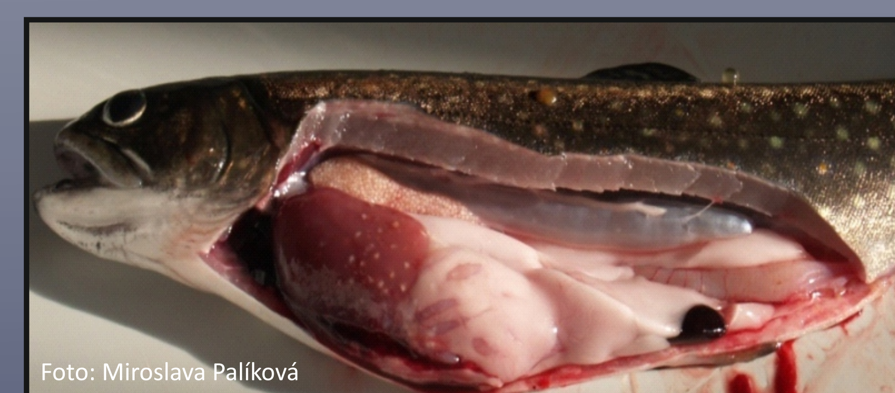
Obr. 3. R. acus - kapsuly v játrech