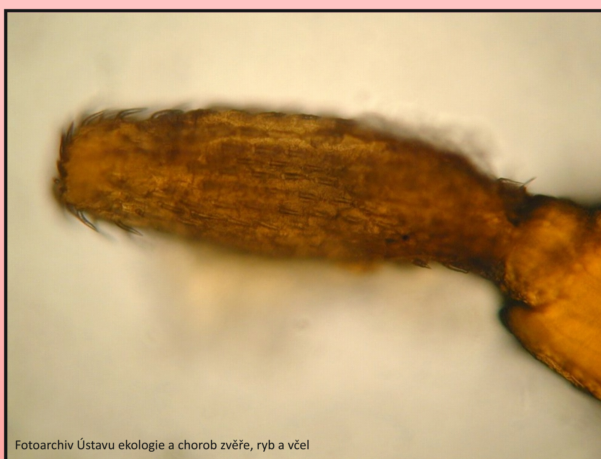
Obr. 2. Mikroskopie: Echinorhynchus truttae