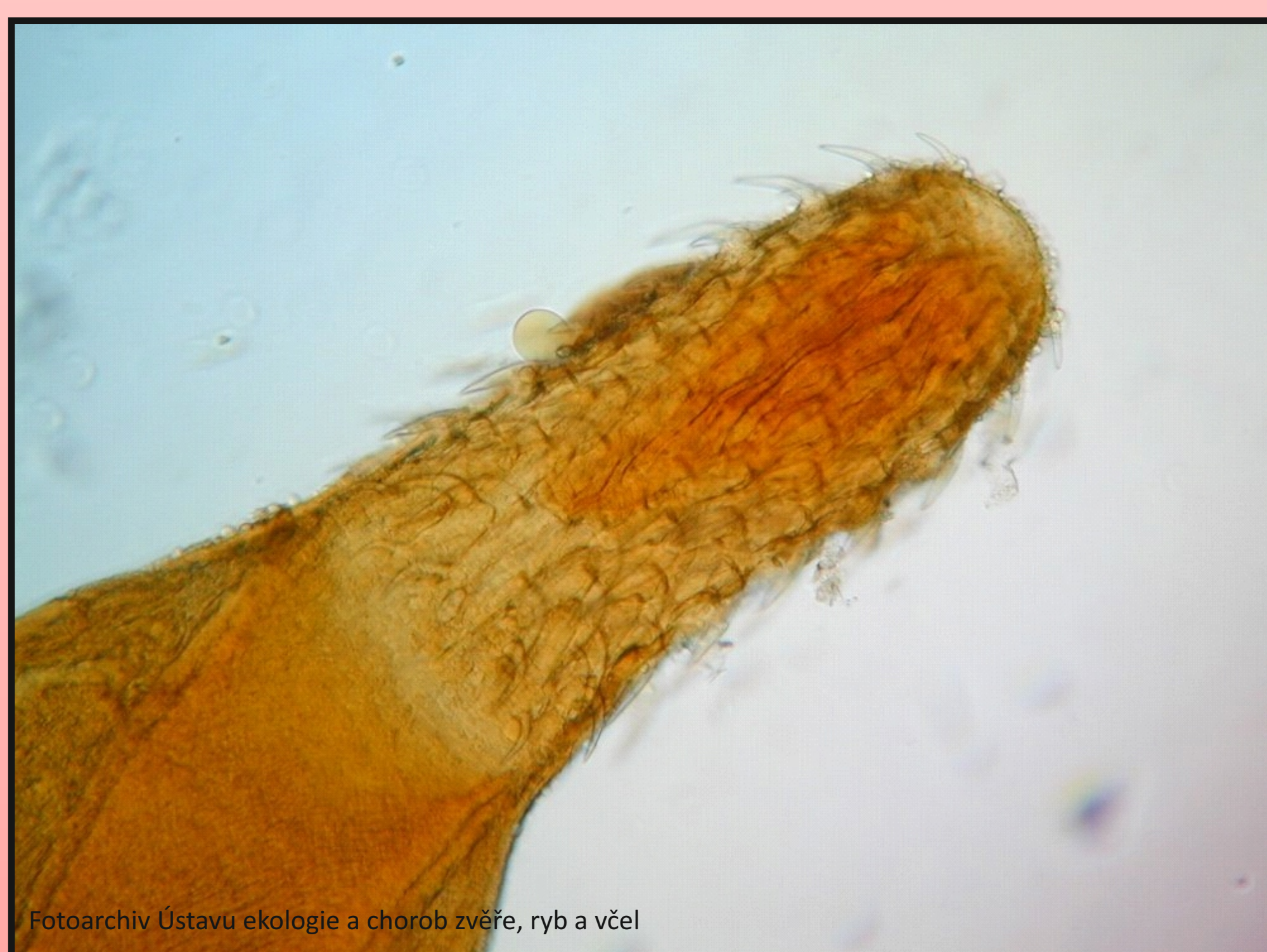
Obr. 1. Mikroskopie: Acanthocephalus lucii