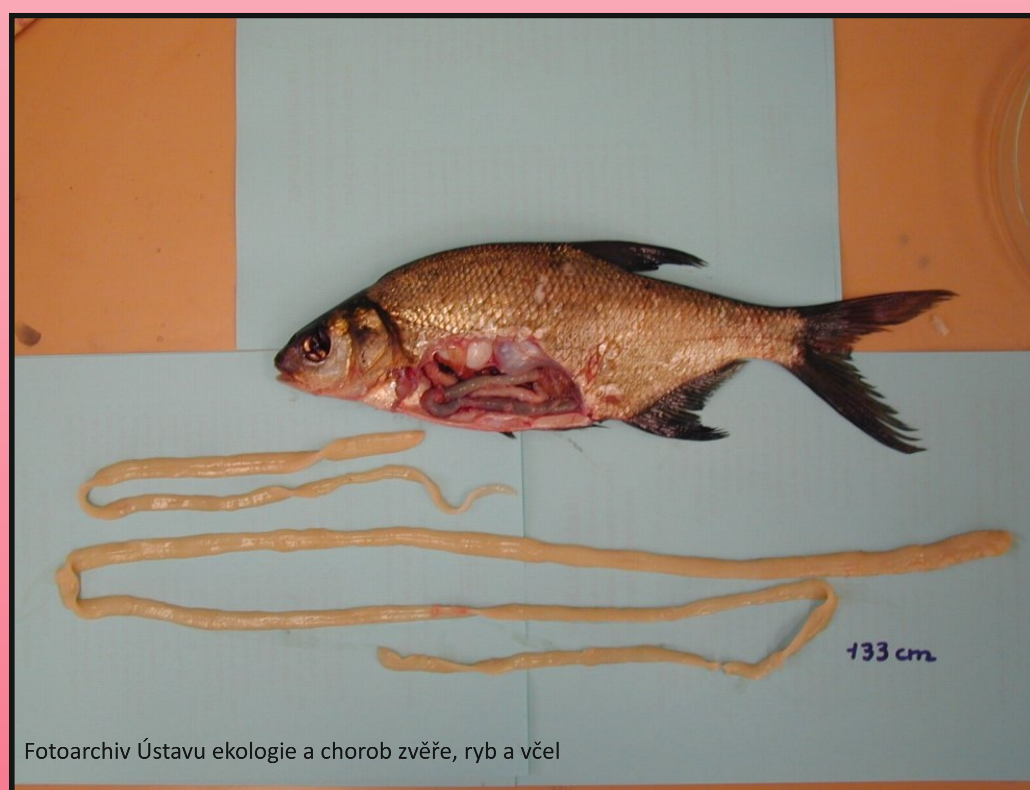
Obr. 2. Ligula intestinalis - plerocerkoid