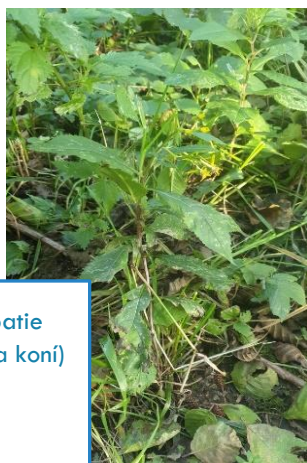
Starček Fuchsův ( Senecio ovatus )