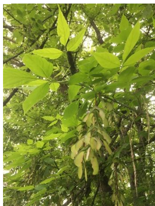
Javor jasanolistý ( Acer negundo ): vzrostlý strom s nažkami

Akutní nezátěžová rhabdomyolýza (Atypická myopatie koní)