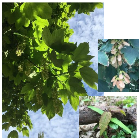
Javor klen ( Acer pseudoplatanus ): vlevo vzrostlý strom, vpravo nahoře nažky, dole semenáček