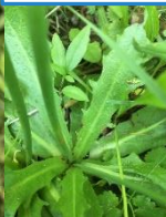
Prasetník kořenatý ( Hypochaeris radicata ): vlevo květ, vpravo přizemní růžice listů