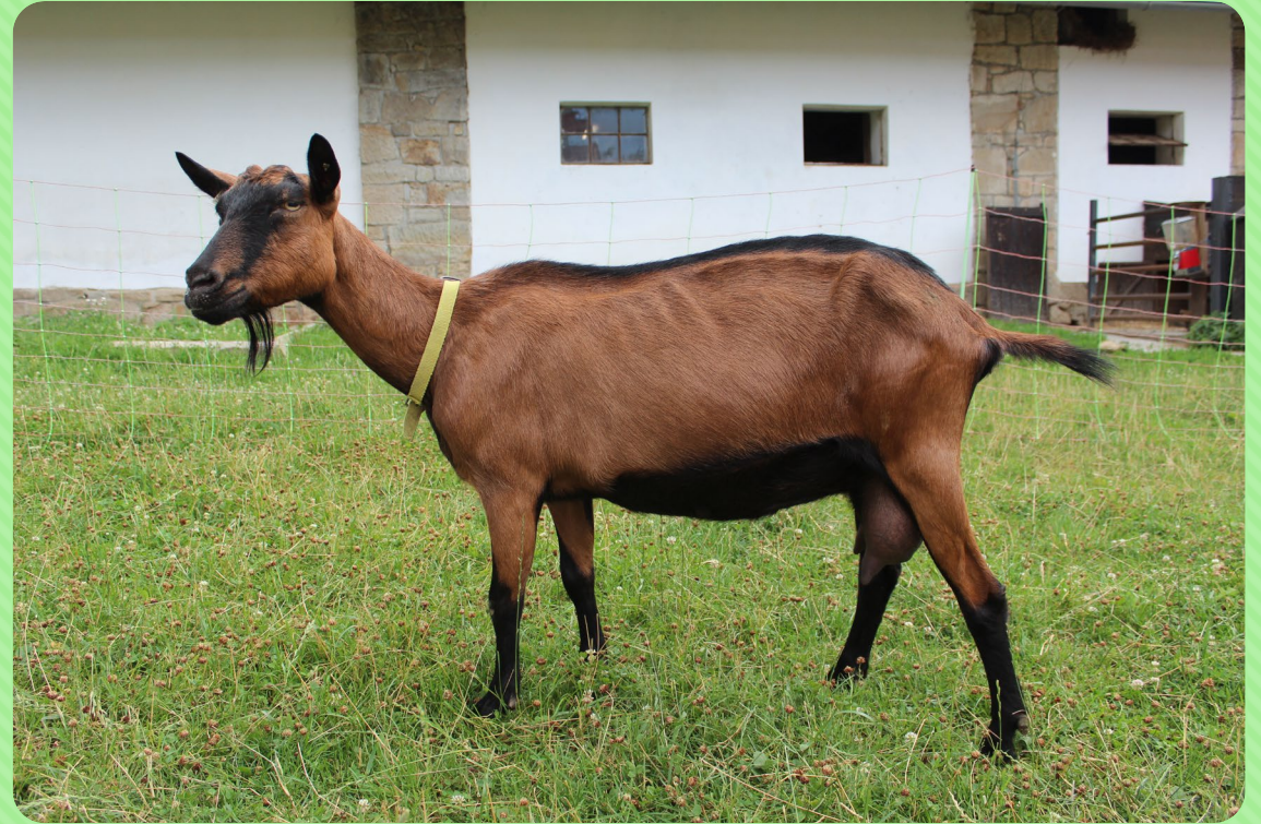
Koza hnědá krátkosrstá (H)