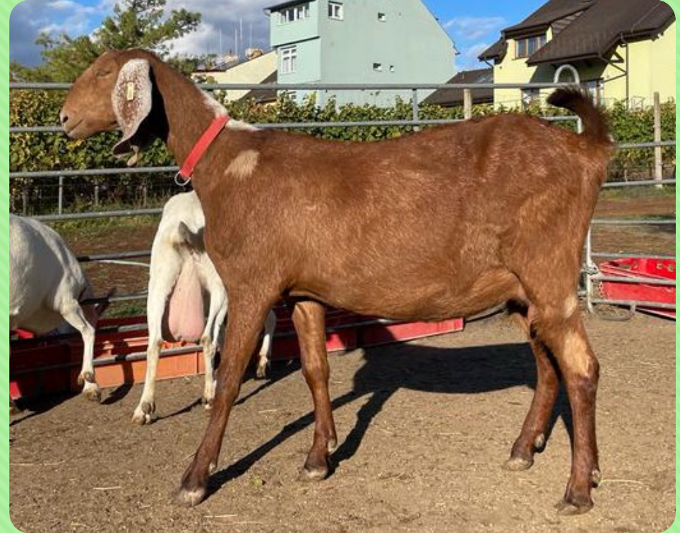
Anglonubijská koza (AN)