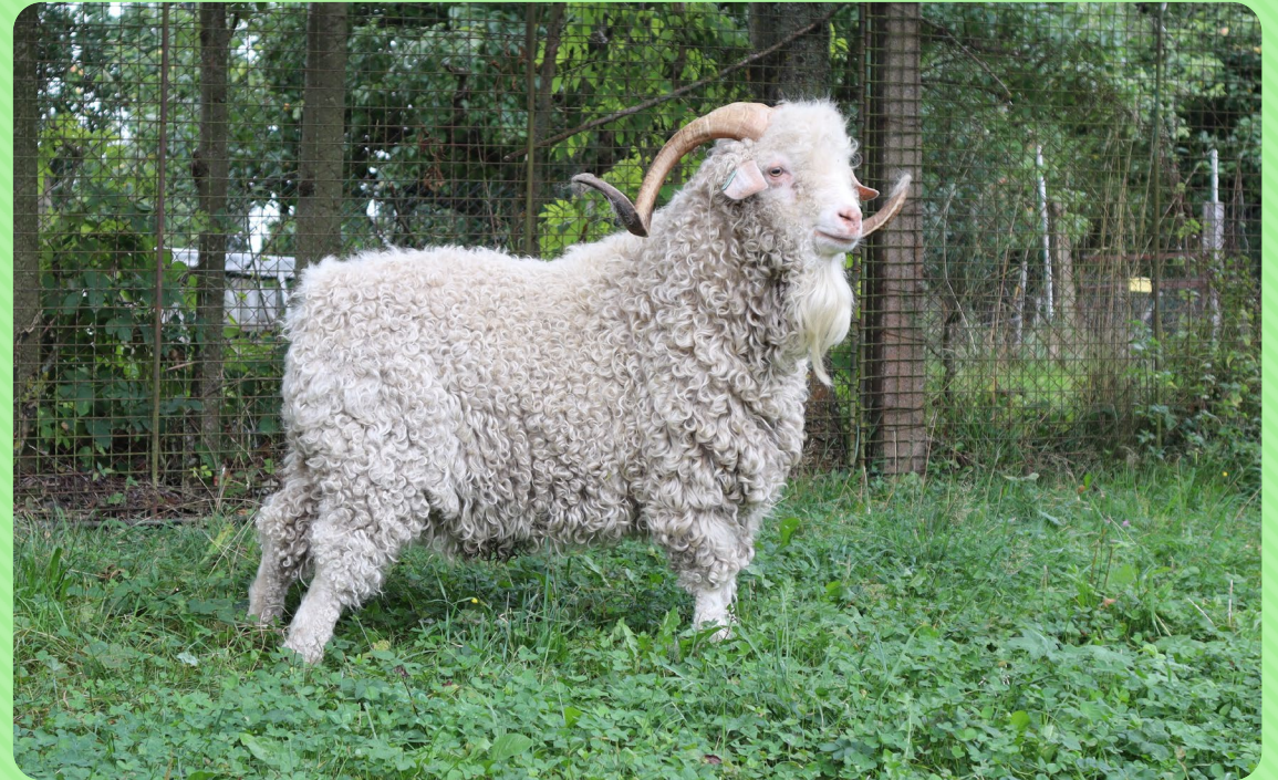
Koza mohérová/angorská (M)