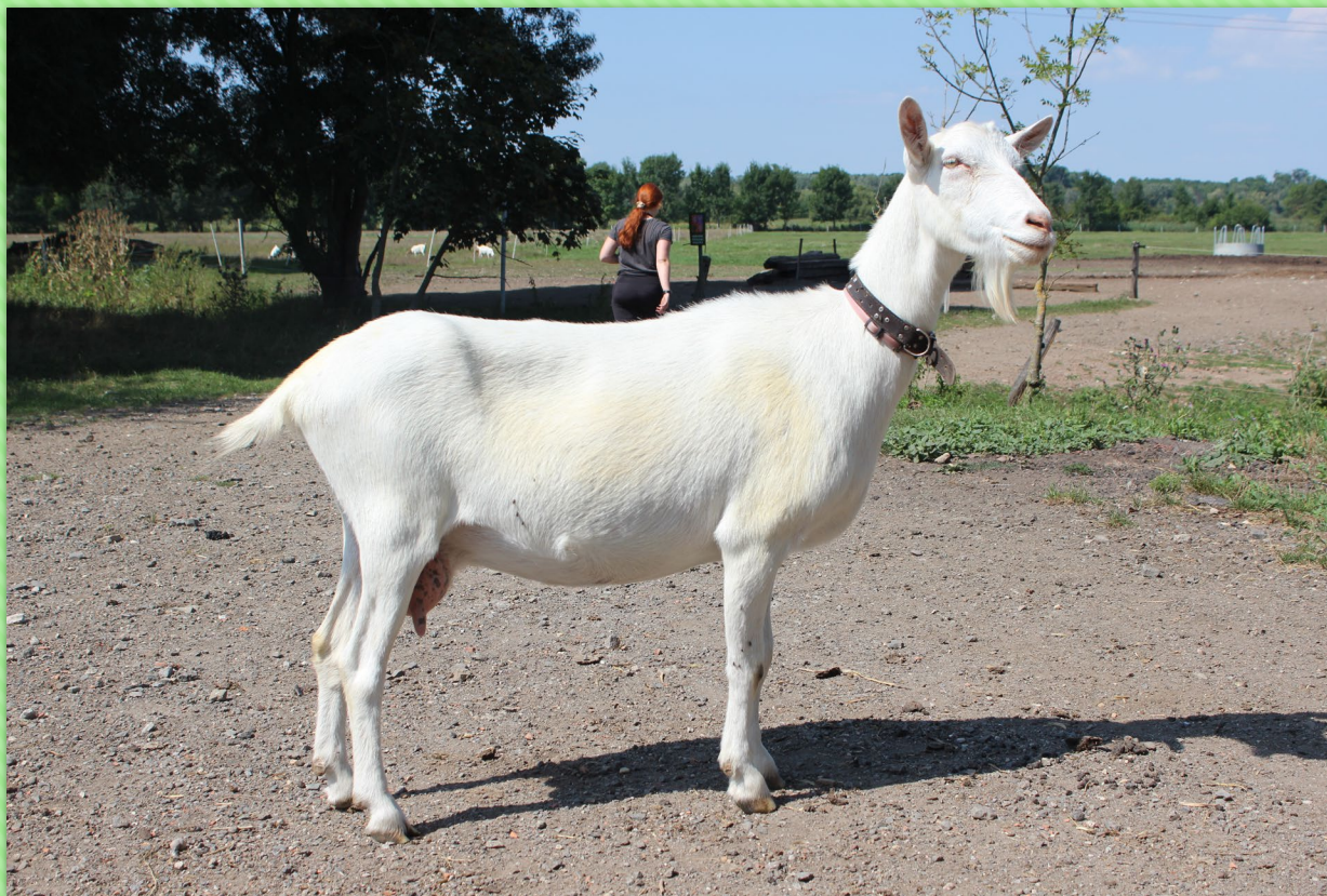
Koza bílá krátkosrstá (B)