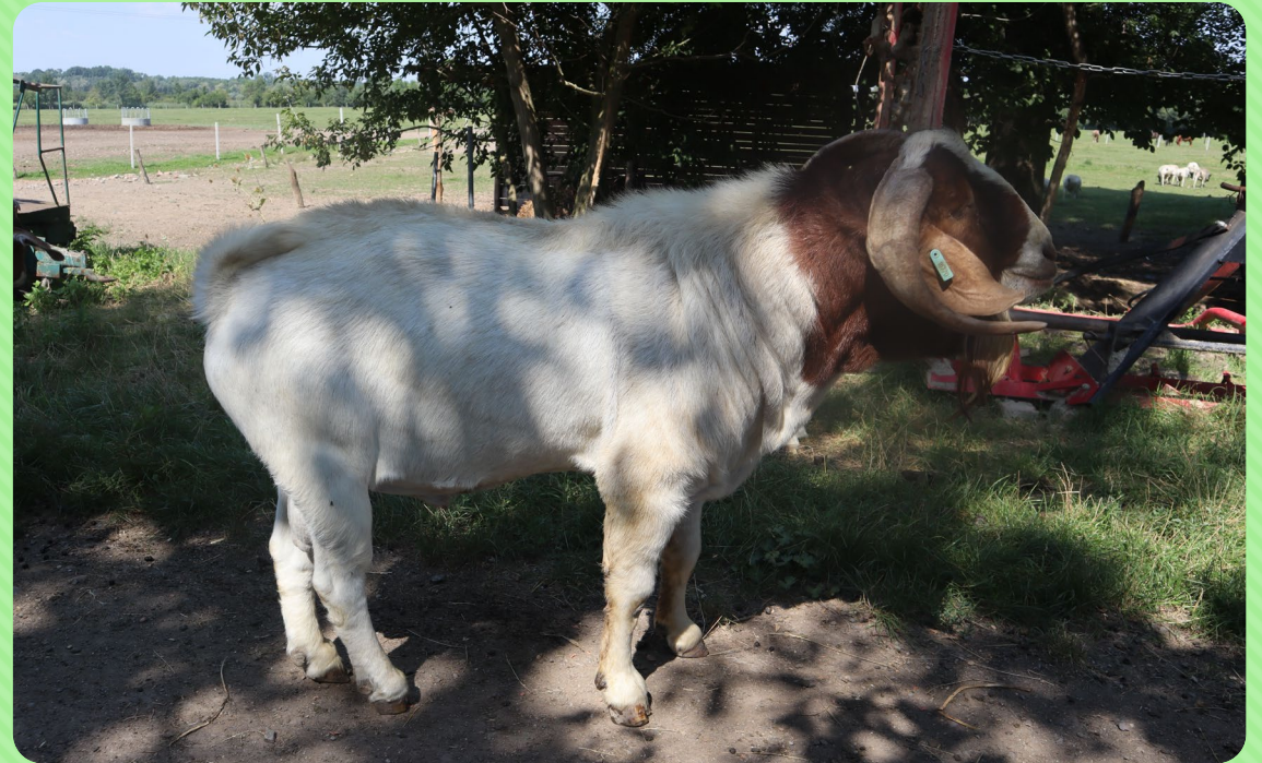
Koza búrská (BU)