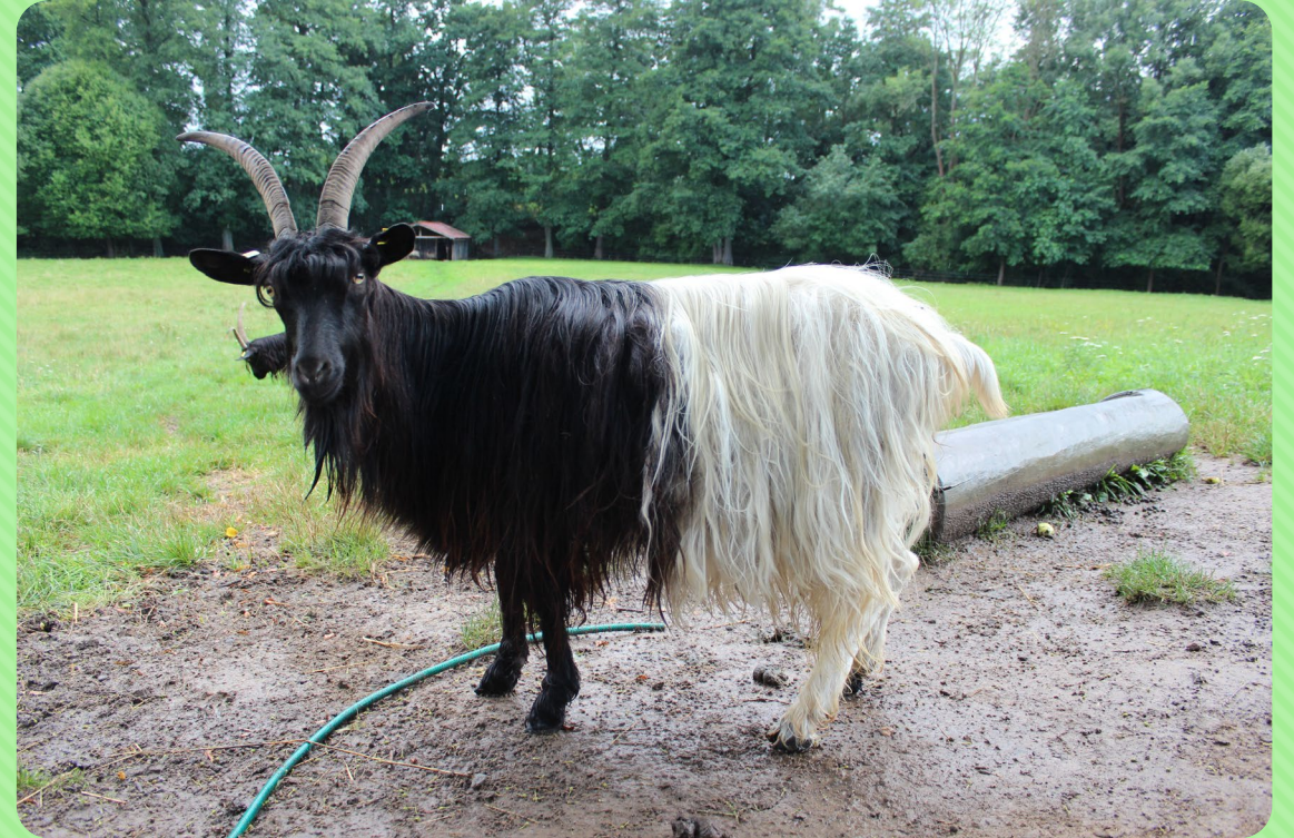
Koza walliserská černokrká (W)