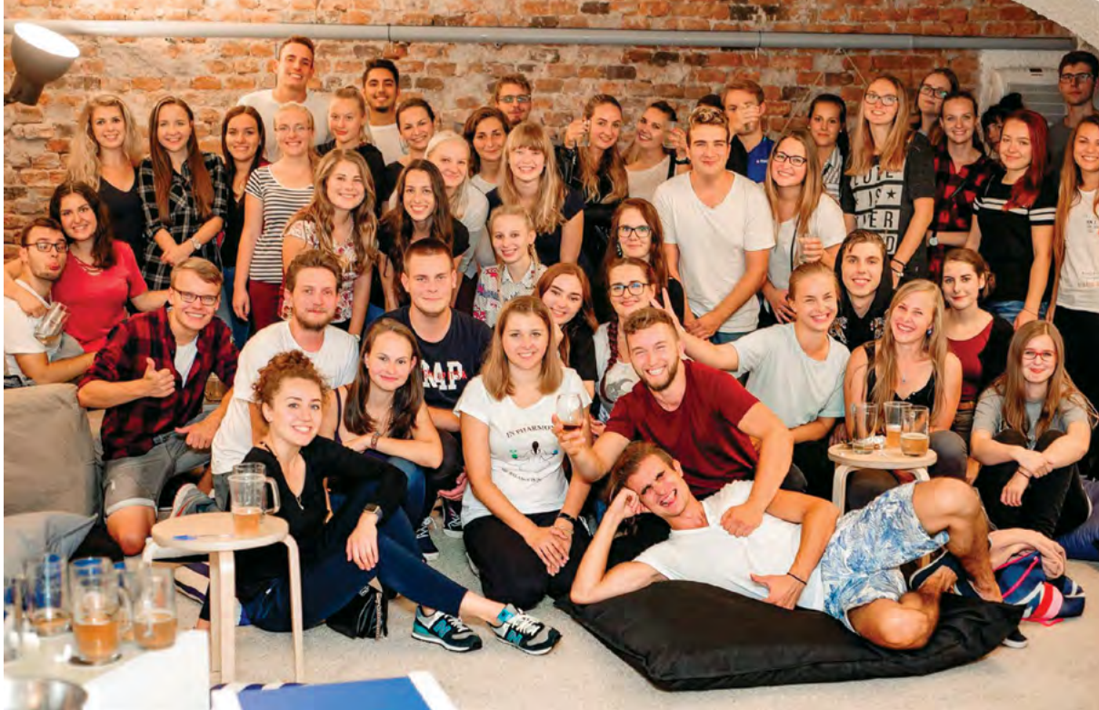
Páteční sightseeing byl zakončen FaF kvízem v Chillárně

kem. Po pauze na doplnění sil jsme vyrazili šalinou do centra na pub tour. Ve dvou z brněnských podniků nás přivítali naši starší kolegové, od kterých jsme se dozvěděli spoustu užitečných věcí a odpovědi na všemožné dotazy (o ochutnávce piva, vína a jiných nápojů ani nemluvě). Celý den byl zakončen (či snad ten druhý započat?) další party.