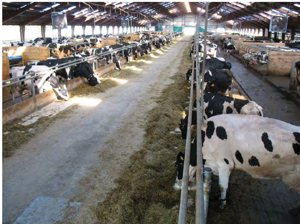
ŠZP Nový Dvůr