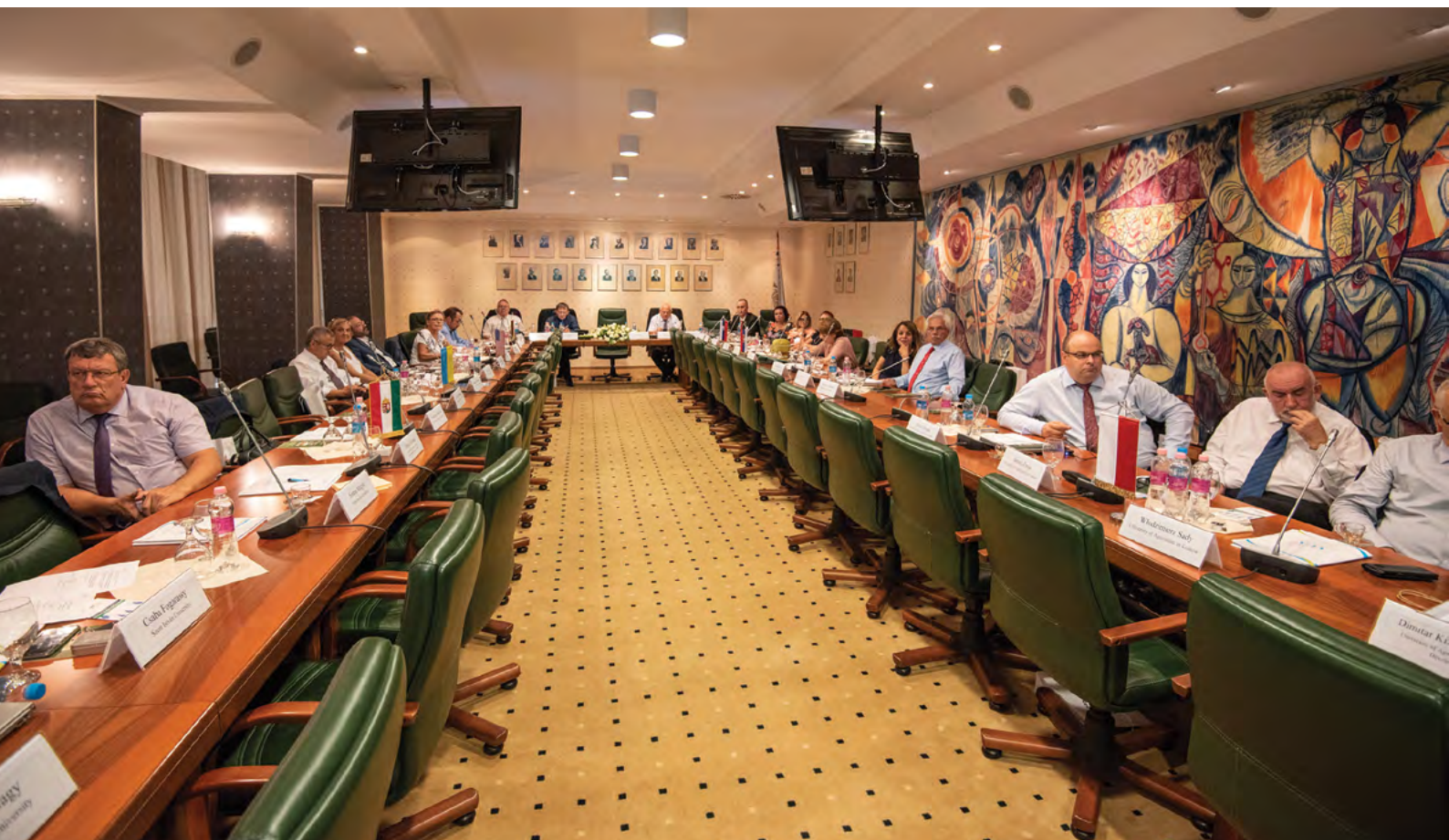
Jednání VUA v Debrecínu v Maďarsku