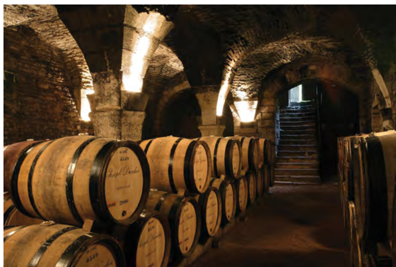
Burgundské sudy mají objem 228 l (Bordeaux 225)

ní klasifikace vín. Světovou výstavou v Paříži v roce 1855 chtěl Napoleon III. trumfnout první londýnskou. Francii představil jako zemi vynikajícího vína a pět milionům návštěvníků mělo být prezentováno nejlepší víno z Bordeaux. Ale jak si mají i neznalí vybrat? Podle nějakého jednoduchého klíče, například kvality vinařství, znělo zadání. Bordeauxská obchodní komora požádala Unii nákupčích vín, aby jednotlivá vinařství zařadili do pěti tříd. Měli na to jeden měsíc a vytvořili Les Grands Crus Classés en 1855 , která se používá dodnes a navíc s pouhými dvěma významnými změnami! Tou největší bylo povýšení vinic Château Mouton Rothschild do nejvyšší kategorie premier cru v roce 1973. Předcházelo mu padesát let usilovné práce a diplomatického manévrování majitele usedlosti barona Philippe de Rothschilda. Automobilový závodník, který na svém Bugatti bojoval se Louistem Chironem, divadelní scenárista a majitel Château Mouton své vinařství neuvěřitelně pozvedl. Zavedl tehdy revoluční plnění