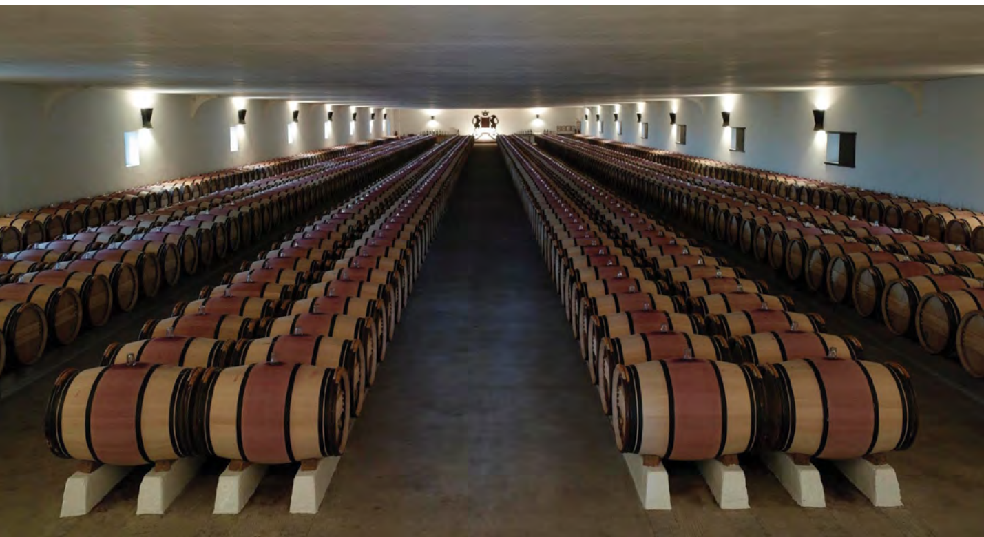
Château Mouton Rothschild

ní klasifikace vín. Světovou výstavou v Paříži v roce 1855 chtěl Napoleon III. trumfnout první londýnskou. Francii představil jako zemi vynikajícího vína a pět milionům návštěvníků mělo být prezentováno nejlepší víno z Bordeaux. Ale jak si mají i neznalí vybrat? Podle nějakého jednoduchého klíče, například kvality vinařství, znělo zadání. Bordeauxská obchodní komora požádala Unii nákupčích vín, aby jednotlivá vinařství zařadili do pěti tříd. Měli na to jeden měsíc a vytvořili Les Grands Crus Classés en 1855 , která se používá dodnes a navíc s pouhými dvěma významnými změnami! Tou největší bylo povýšení vinic Château Mouton Rothschild do nejvyšší kategorie premier cru v roce 1973. Předcházelo mu padesát let usilovné práce a diplomatického manévrování majitele usedlosti barona Philippe de Rothschilda. Automobilový závodník, který na svém Bugatti bojoval se Louistem Chironem, divadelní scenárista a majitel Château Mouton své vinařství neuvěřitelně pozvedl. Zavedl tehdy revoluční plnění