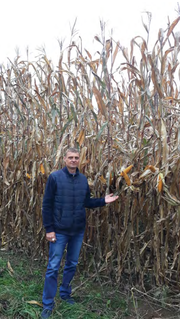
Nový ředitel ŠZP

Školní zemědělský podnik VFU Brno zahrnuje dvě součásti. První z nich představuje Školní zemědělský podnik Nový Dvůr, který je součástí VFU od roku 1946 a je umístěn poblíž hradu Veveří v blízkosti Brněnské přehra-