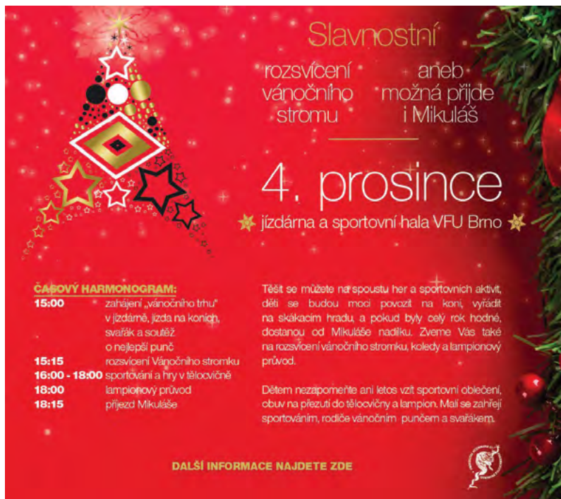
Slavnostní rozsvícení vánočního stromu v areálu univerzity a vánoční punč - pozvánka

text: prof. MVDr. Vladimír Večerek, CSc., MBA foto: autor