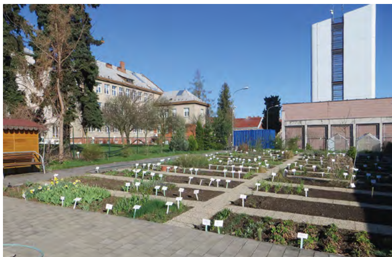
Kvalitní výuka vyžaduje botanické zázemí – Farmaceutická fakulta