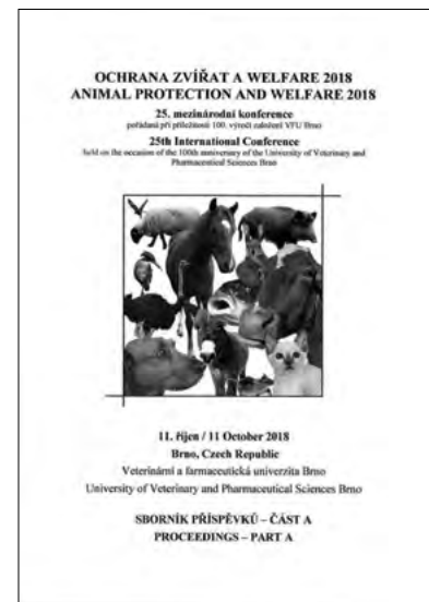
Sborník konference Ochrana zvířat a welfare 2018