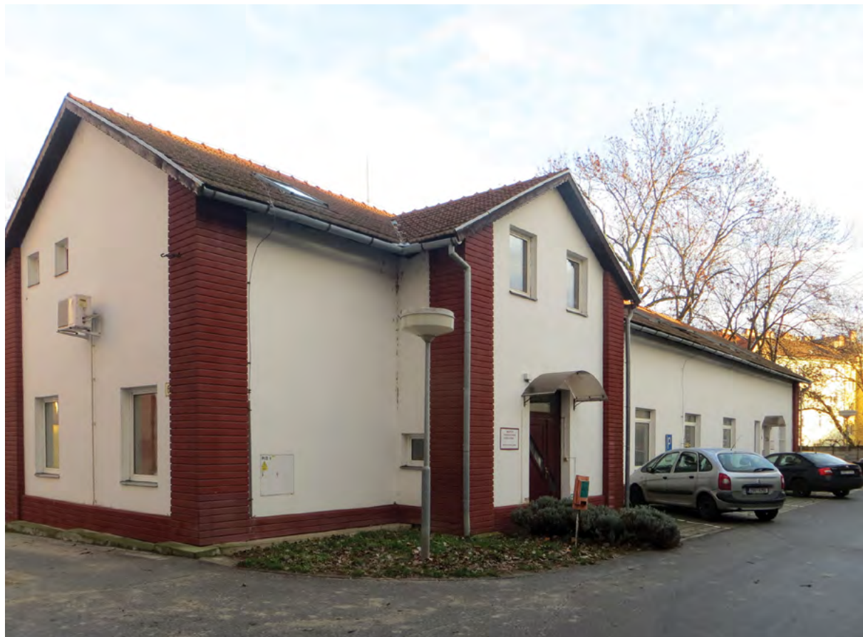
Budova ICV – výukové centrum