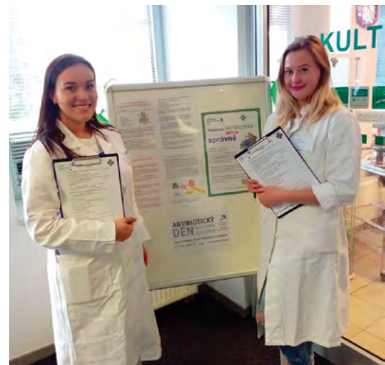
Studenti FaF ve Fakultní lékárně v rámci Antibiotického dne

Studenti naší univerzity tedy vyplňovali s veřejností 2 typy dotazníků od ČLnK, která dotazníky eviduje do svého dlouholetého výzkumu. Dotazníky byly pro dospělé pacienty a pro rodiče s dítětem. Za vyplněný dotazník a vyslechnuté rady od proškolených studentů (díky sérii přednášek na téma Antibiotika a jejich rezis-