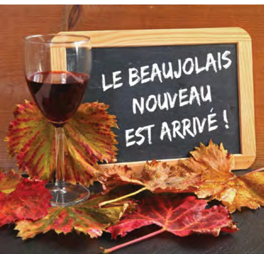
Nové Beaujolais přichází

Když popojedeme kousek směrem k Lyonu, cena vín prudce klesne, jsme v oblasti Beaujolais. Lehká vína s vysokým obsahem kyselin vytváří zdejší raná odrůda Gamay , která sice rodí hodně, ale na úkor kvality, kdepak burgundský Pinot noir . S rozvojem železnice se ale zdejší mladá, lehká a levná vína prosadila v Paříži. Jen ta pověst! Málokdo je bral vážně. V roce 1970 se do obchodu s vínem Beaujolais pustil Georges Duboeuf, négociant , který založil podnik Les Vins Georges Duboeuf a začal masivně propagovat mladé Beaujolais Nouvelle . Jeho transparenty začaly hlásat ve všech restauracích „Le