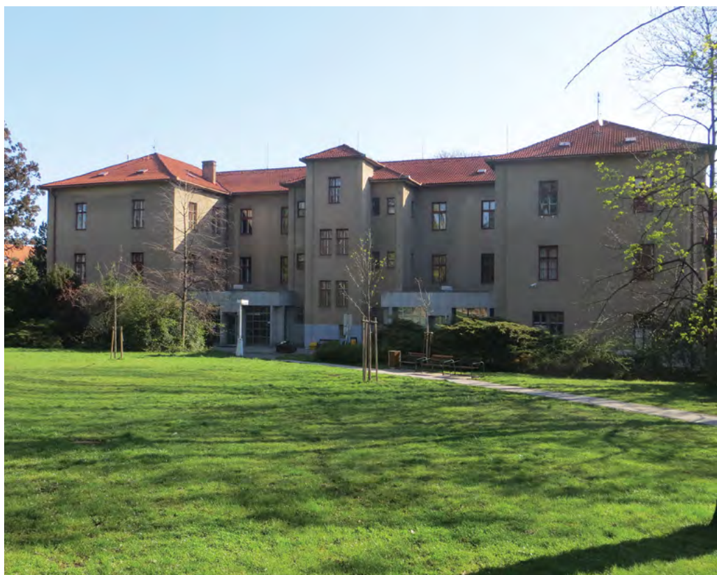
Administrativní centrum univerzity – rektorát