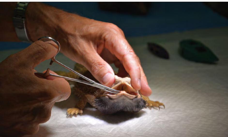
Zpráva o vnitřním hodnocení kvality zahrnuje také posouzení výuky na klinikách