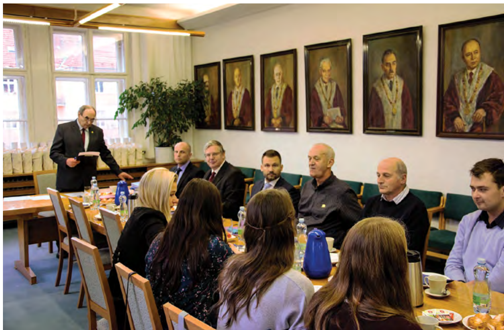
Jednání AS VFU Brno v den 100. výročí založení univerzity

Významnou součástí Veterinární a farmaceutické univerzity Brno je akademická samospráva, která reguluje vývoj VFU Brno od svého vzniku v roce 1990 na základě zákona o vysokých školách a určuje tak hlavní směry dalšího rozvoje univerzity pro příští období. Je tedy zřejmé, že 100leté výročí založení Veterinární a farmaceutické univerzity Brno je významným výročím také pro tento samosprávný orgán univerzity, a tak Akademický senát VFU Brno přistoupil k oslavě tohoto výročí v rámci prosincové činnosti AS VFU Brno 2018.