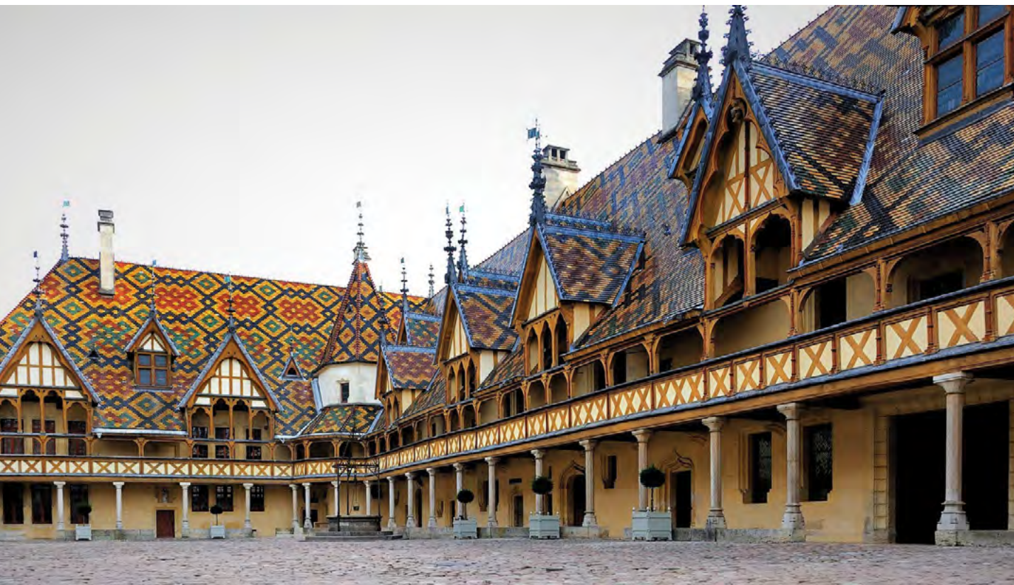
Hospice de Beaune jistě stojí za návštěvu