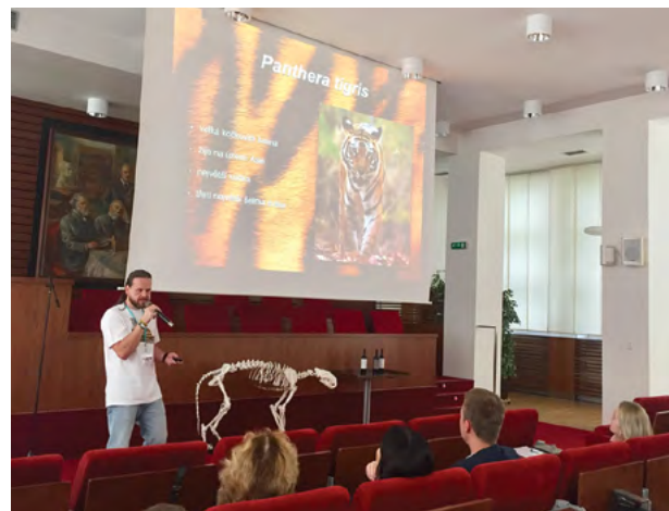
Poutavá prednáška o záchraně tygrů

Počet tigrov žijúcich v zajatí je v porovnaní s ich počtom vo voľnej prírode niekoľkonásobne vyšší.