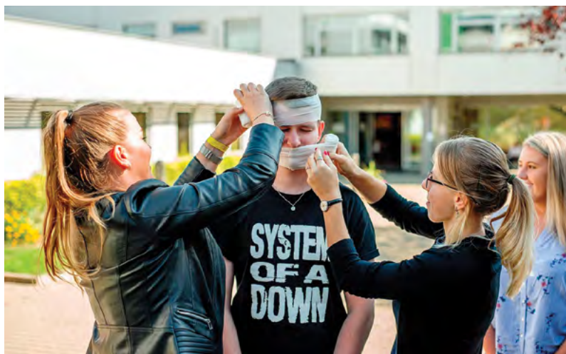
Vítání prváků FaF

V neděli jsme se nejdřív opět sešli v posluchárně, kde nám byly předány informace, rady, tipy a triky ohledně studia. Po krátké pauze jsme se znovu rozčlenili do seminárních skupin a odpoledne jsme strávili chozením po stanovištích v rámci areálu. Na každém stanovišti na nás čekalo několik starších spolužáků, kteří nám prezentovali jednotlivé předměty v prvním ročníku a předávali nám své zkušenosti. Kromě nich na nás čekaly i úkoly, mj. jsme házeli létajícím talířem, museli si zapamatovat latinská slovíčka, byli jsme dotazováni na věci, které jsme od maturity stihli zapomenout, nacvičili jsme si praktické dovednosti jako oblékání pláště na čas nebo mumifikace spolužáků a tři odvážlivci si vyzkoušeli, jak těžká ta organická chemie vlastně je, zvláště