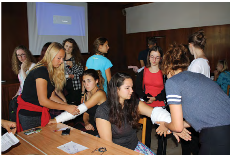
Zvládání techniky obvazování