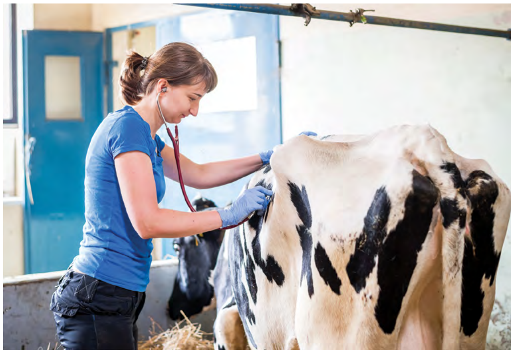
Změna rozpočtu směřuje na fakulty k podpoře vzdělávací činnosti

V prosinci rektor VFU fakultám navýšil rozpočet o dalších 1,122 mil. Kč. Rozpočet FVL se navýšil o dalších 461 000 Kč, rozpočet FVHE o dalších 412 000 Kč a rozpočet FaF o dalších 249 000 Kč. Tyto prostředky byly získány opět z MŠMT na použití v mzdové oblasti fakult. Jejich