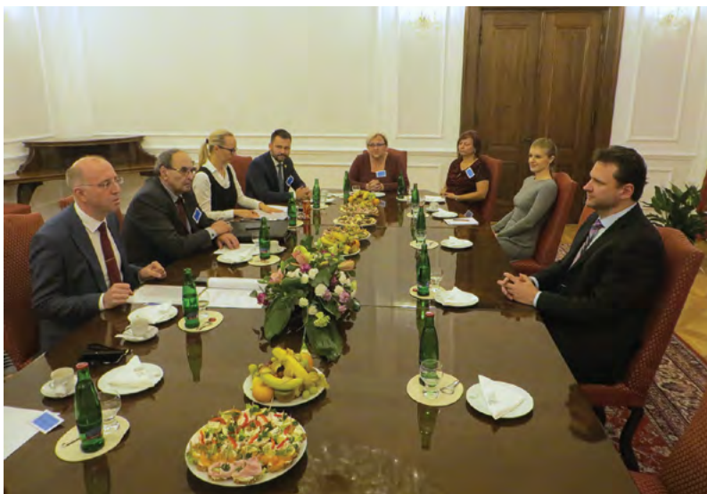
Jednání Kolegia rektora s předsedou Poslanecké sněmovny ČR

► Veterinární a farmaceutická univerzita Brno byla založena přijetím zákona č. 76/1918 Sb. z. a n., o zřízení československé státní „Vysoké školy zvěrolékařské v Brně“ s vyučovací řečí českou. Stalo se tak 12. prosince 1918, 45 dní po založení samostatné Československé republiky na schůzi Národního shromáždění.