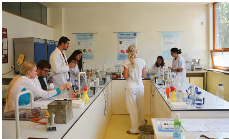
Navýšení rozpočtu podpoří výuku na fakultách

dělení mezi fakulty vychází z podílu dělení provozních prostředků mezi fakultami.