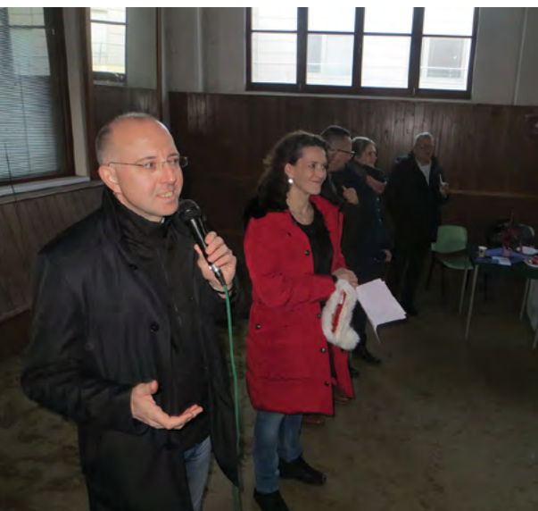
Rektor VFU Brno vydává pokyn k rozsvícení vánočního stromu

Advent a s ním předvánoční čas se rozhostil také v areálu Veterinární a farmaceutické univerzity Brno. 4. prosince 2018 se konalo na VFU Brno slavnostní rozsvícení vánočního stromu.