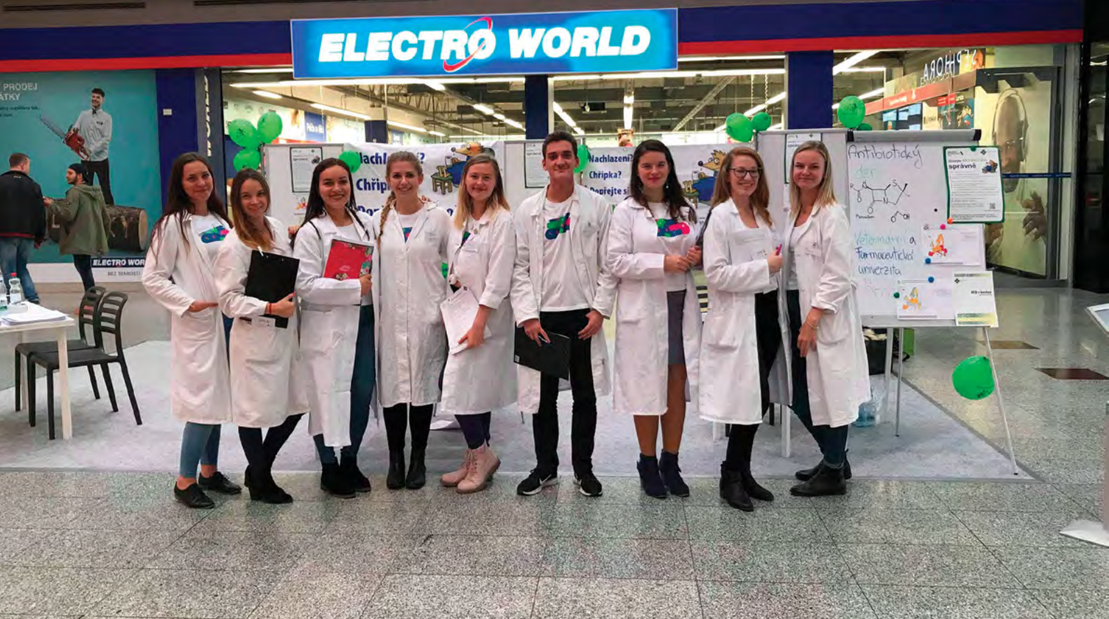
Studenti FaF v obchodním centru Olympia Brno při Antibiotickém dnu