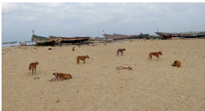
V rámci mobilní se studenti setkávají i se zcela jiným přístupem k péči o zvířata, než je v ČR