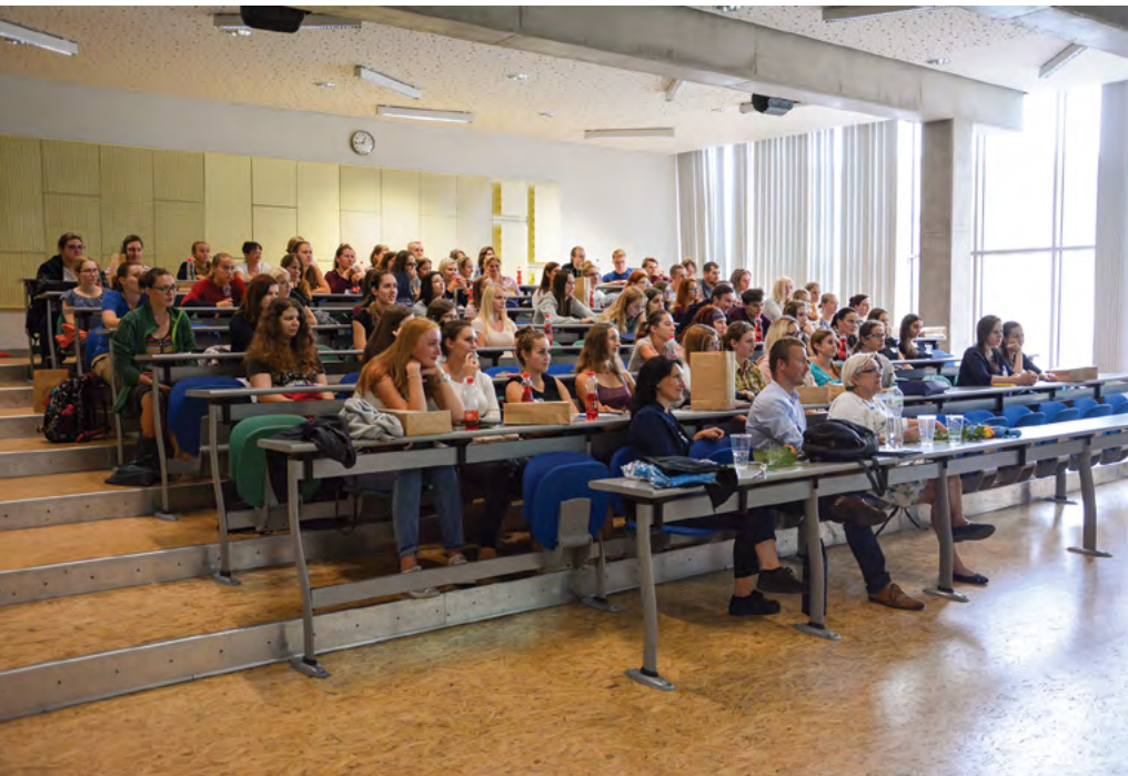
Vítání prváků na FVHE