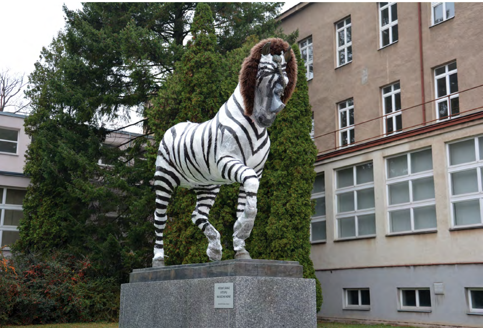
Půlení ve veterinární výuce provází tvůrčí proměna koně Arda