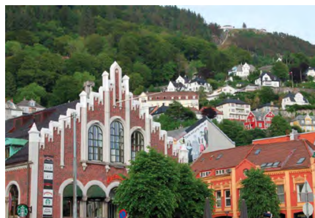
Bergen s vyhlídkovou lanovkou v pozadí