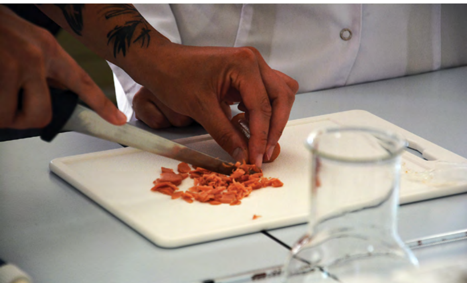
Výuka v hygieně potravin je součástí zprávy o vnitřním hodnocení kvality

dále posouzení kvality mezinárodní činnosti, posouzení péče o studenty a účastníky celoživotního vzdělávání, posouzení kvality pracovníků a kvality habilitačních řízení a řízení ke jmenování profesorem, posouzení kvality na úrovni prostorového, přístrojového vybavení, materiálového zabezpečení, informačního zabezpečení (IT, knihovna, informační zdroje), administrativního zabezpečení a případně dalšího zabezpečení činností VFU, posouzení kvality akademického pro-