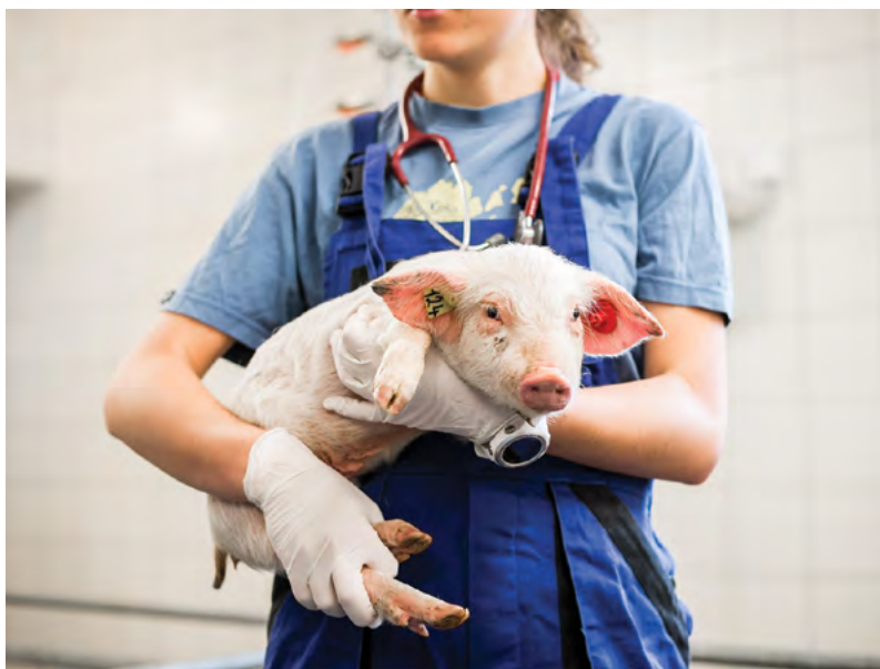
Praktická výuka klinické veterinární medicíny je pozitivem v kvalitě vzdělávací činnosti

Veterinární a farmaceutická univerzita Brno vytvořila, uvedla do realizace a rozvíjí systém zajišťování a vnitřního hodnocení kvality činností na univerzitě.