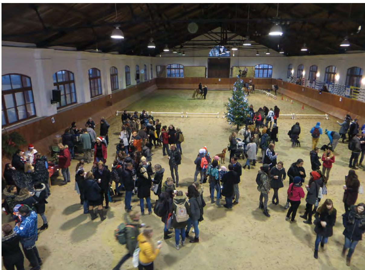
Předvánoční setkání v jezdecké hale univerzity