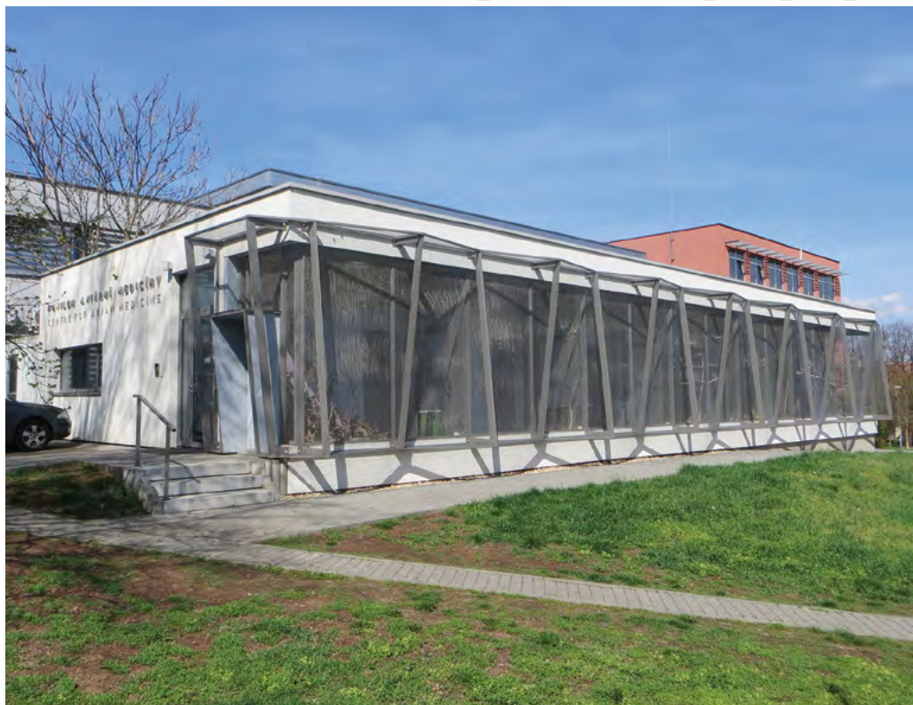
Centrum aviární medicíny