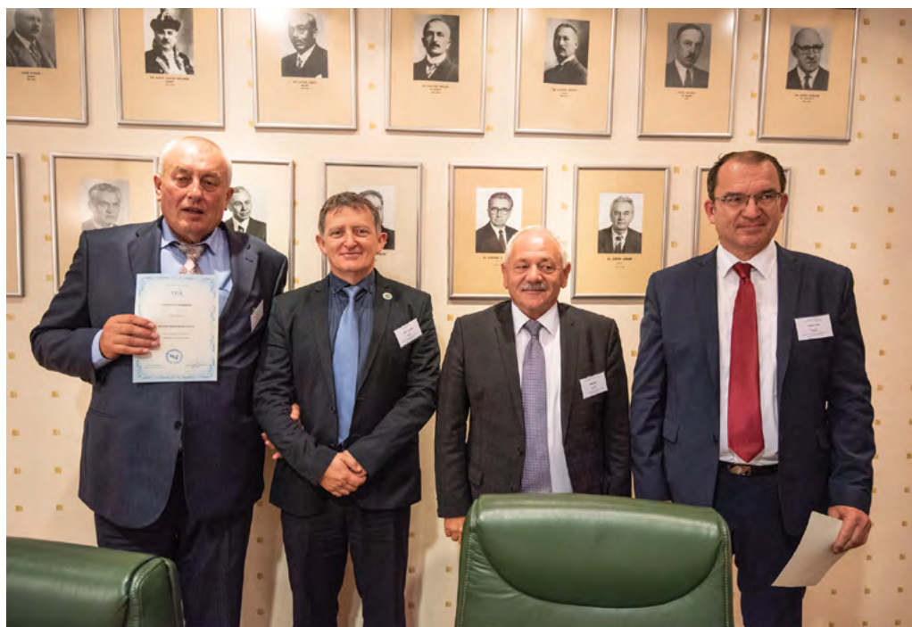
Předávání „Potvrzení o přijetí“ za členy VUA

Členství VFU Brno ve VUA přináší pro naši univerzitu celou řadu benefitů, a to od možných výměnných pobytů studentů nebo aka-