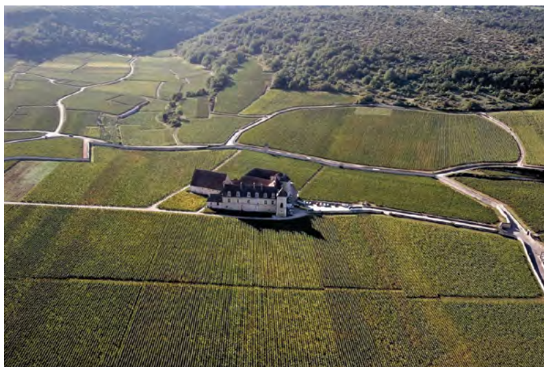
Vyhlášené tratě Clos de Vougeot