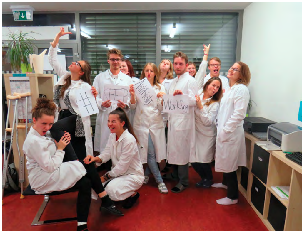
Dobrá nálada a humor v kolektivu studentů při Antibiotickém dnu

text: Edu tým Unie studentů farmacie