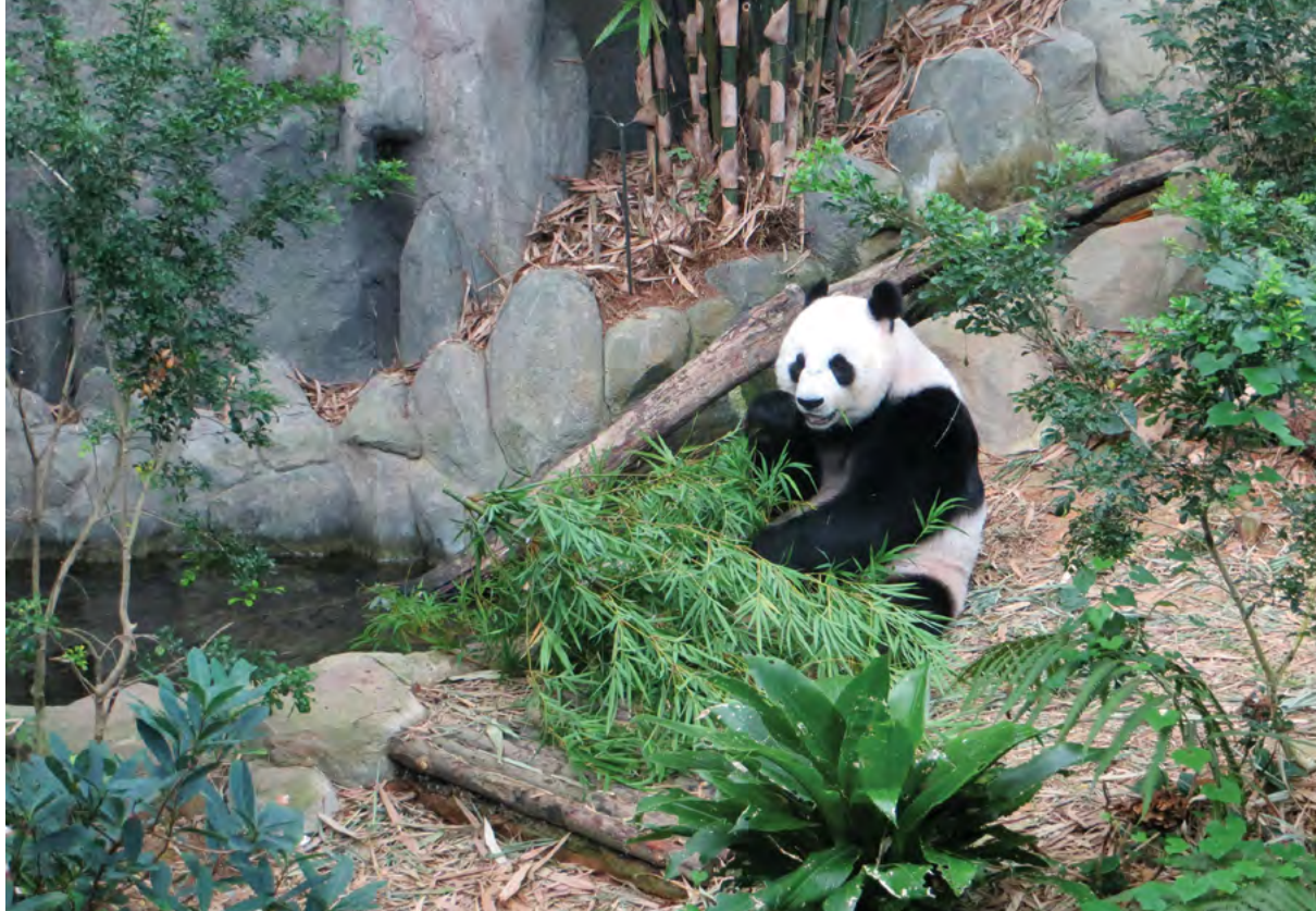
Symbol ochrany zvířat – panda – 25 let konference Ochrana zvířat a welfare