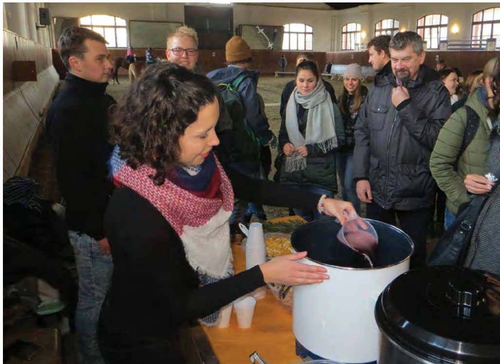
V soutěži o nejlepší punč zvítězil punč FVHE