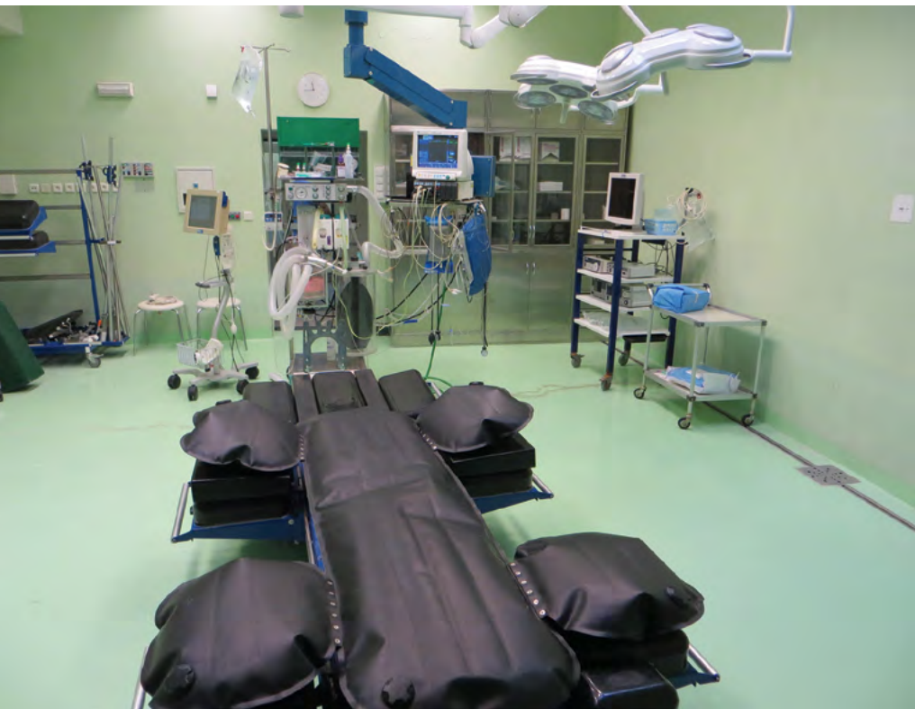
Zázemí operačních sálů pro velká zvířata je zárukou kvalitní veterinární činnosti univerzity

Součástí každého systému kvality je nastavení zpětných vazeb, sebehodnotící zpráva proto popsala komplex zpětných vazeb v systému opírající se zejména o zpětné vazby na úrovni zajišťování kvality činností (nastavení pravidel, vlastní činnosti, monitoring činností), na úrovni vnitřního hodnocení kvality činností (nastavení pravidel, vlastní činnosti, posouzení činností), a na úrovni zvláštních systémů hodnocení kvality vzdělávací, tvůrčí a s nimi souvisejících činností, tj. zejména zaměřených na zpětnou vazbu od stu-