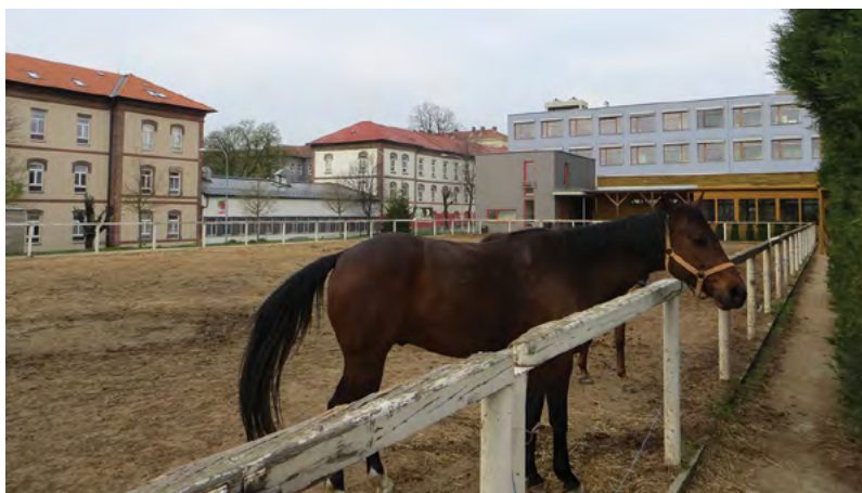
Kvalita výuky je podpořena zázemím pro kontaktní výuku na zvířatech