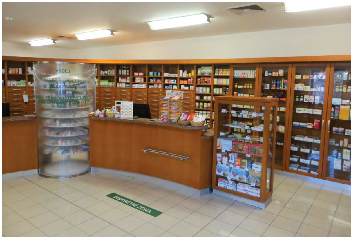
Lékárna v areálu VFU