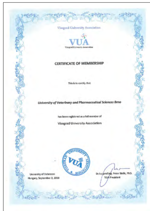
Potvrzení o přijetí VFU Brno za řádného člena Visegrad University Association