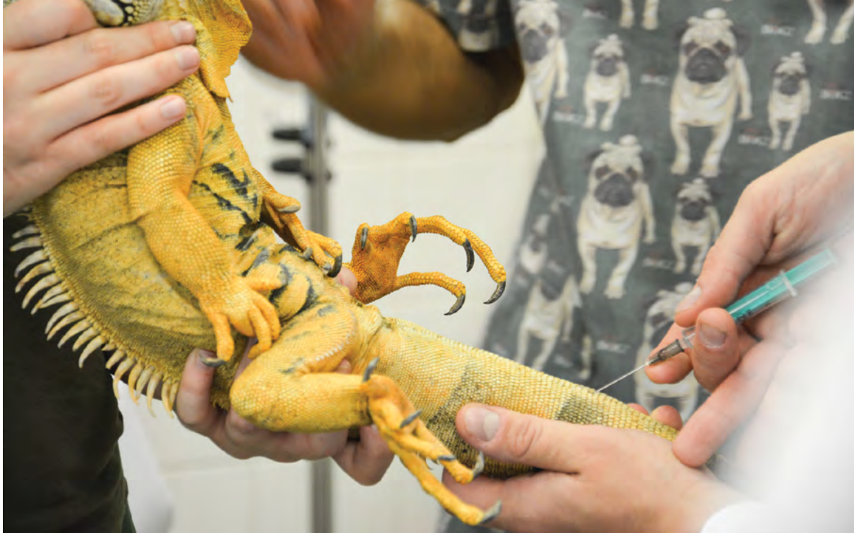
Rada pro vnitřní hodnocení směřuje vzdělávání k vyšší kvalitě