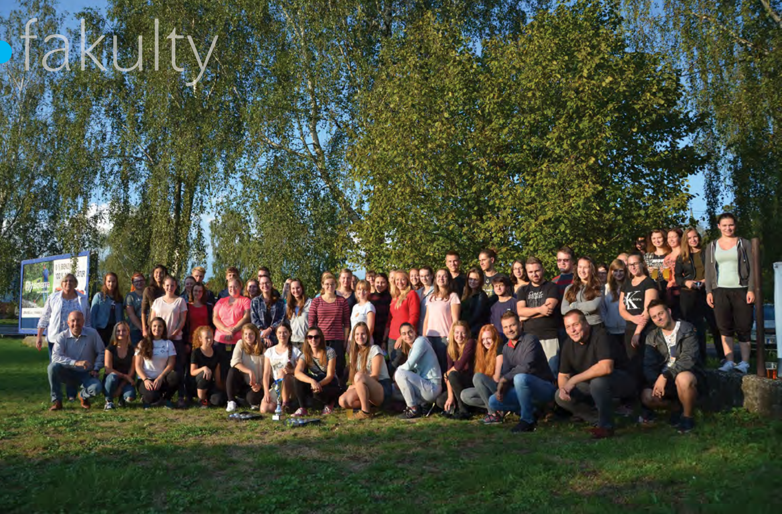
Vítání prváků FVL a FVHE na ŠZP