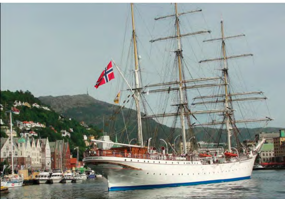
Bergen – Norsko

exotická onemocnění a nákazy zvířat a lidí.