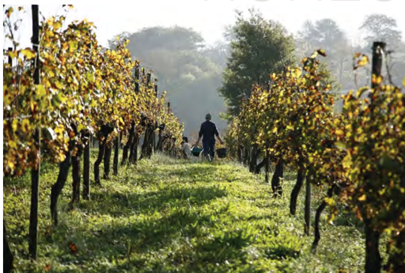
Základem vína je péče o vinohrad