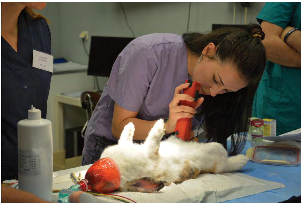
Kontaktní výuka na zvířatech je dokladem kvality veterinárního vzdělávání

Obsahem Zprávy je tak posouzení celého systému zajišťování a vnitřního hodnocení kvality činností na VFU, posouzení poslání, strategického záměru a aktuálních záměrů VFU, posouzení kvality vzdělávací činnosti v bakalářských a magisterských studijních programech, posouzení kvality vzdělávací činnosti v doktorských studijních programech, posouzení kvality vzdělávací činnosti v celoživotním vzdělávání, posouzení kvality tvůrčí činnosti, dále spolupráce s praxí a naplňování společenské odpovědnosti,