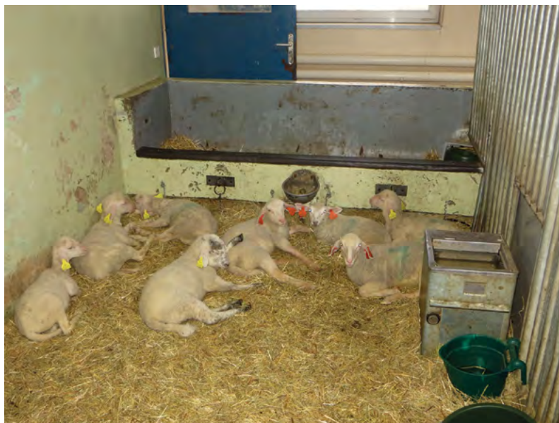
Klinické zázemí je podmínkou pro úspěšnou veterinární výuku