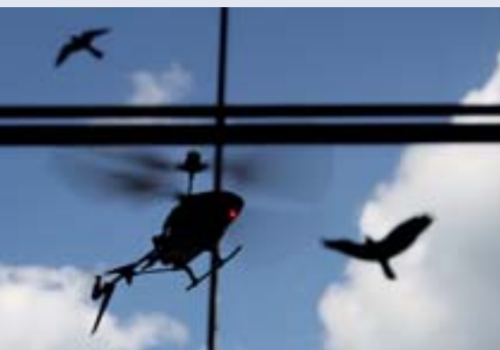
■ Někteří dokonce ve foyer SIC usedli do „kokpitu“ vrtulníku

dý, kdo chtěl přispět a podpořit opuštěná zvířata. Závodníci si mohli vybrat, v jaké kategorii se soutěže zúčastní. Každý si mohl zvolit celkem ze tří kategorií: autíčko, vrtulník, tank. Všechny dopravní prostředky zajistili pořadatelé, povoleny byly i vlastní stroje.