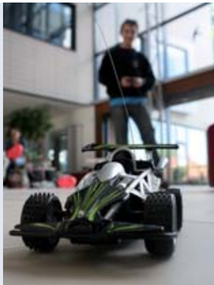
■ Pořadatele si pro závodníky připravili technicky náročnou trať