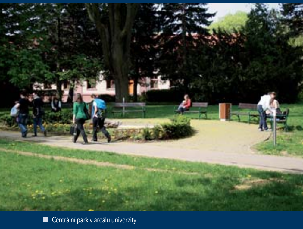
■ Centrální park v areálu univerzity

a příjmy na stavební činnost a investiční (kapitálové) přístrojové vybavení.