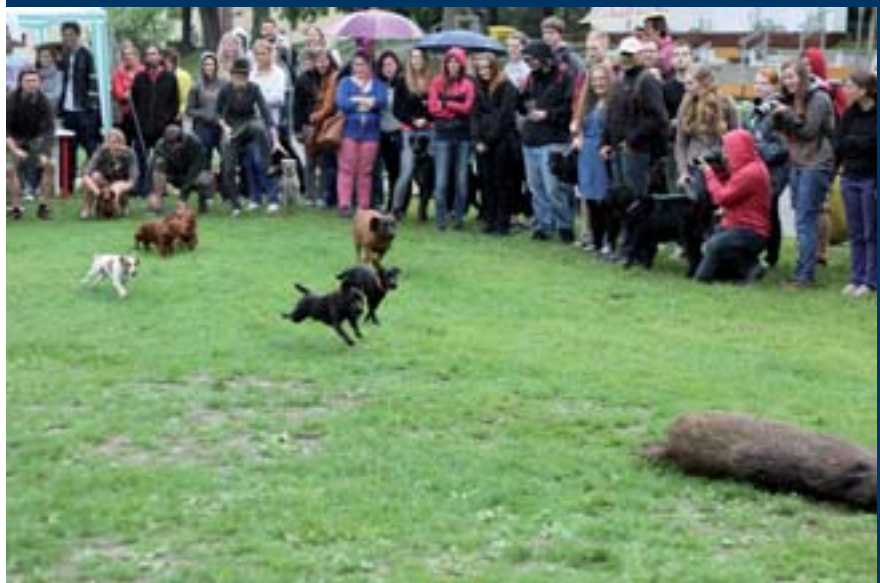
■ Ukázka práce loveckých psů