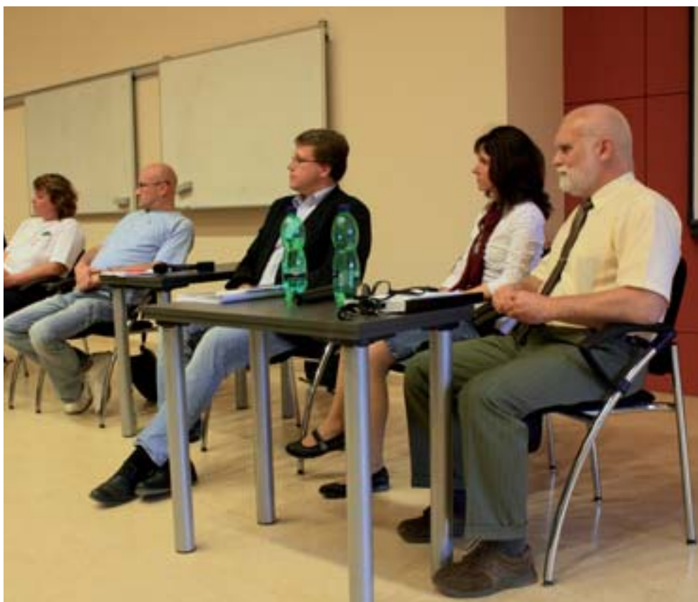
■ Beseda probíhala ve formě interaktivní diskuze mezi hosty i publikem

Navzdory vrcholícímu mistrovství světa v ledním hokeji byl o besedu zájem. Sešlo se na sedm desítek zájemců. Zájem o ni projevil nejen studenti a zaměstnanci univerzity, ale také široká veřejnost. V půlce května tak navštívili Veterinární a farmaceutickou univerzitu Brno chovatelé zájmových zvířat, majitelé chovných