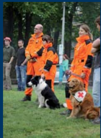
■ Psi-záchranáři předvedli svou náročnou práci