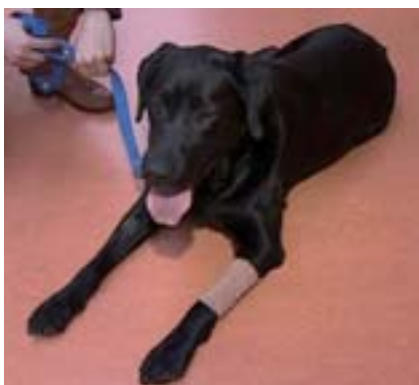
■ Labradorka Domča

Když zdravý muž nebo žena potkají na ulici jakkoli postiženého člověka, obvykle to v nich vyvolá lítost. Handicapovaní lidé si zaslouží pozornost ze strany zdravých. Ti empatičtější se pak snaží lidem, které osud připravil o zdraví, pomáhat.