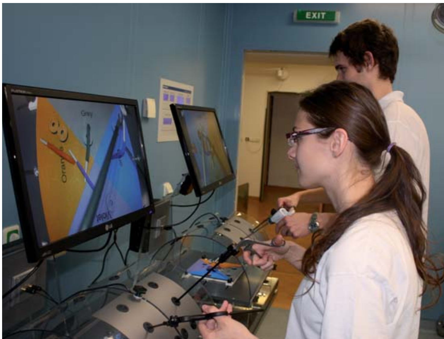
■ Návčik praktických dovedností studentů veterinárního lékařství

V kapitole Učitelé a personál (kapitola 10) je popsáno personální zabezpečení veterinárního vzdělávání na univerzi-