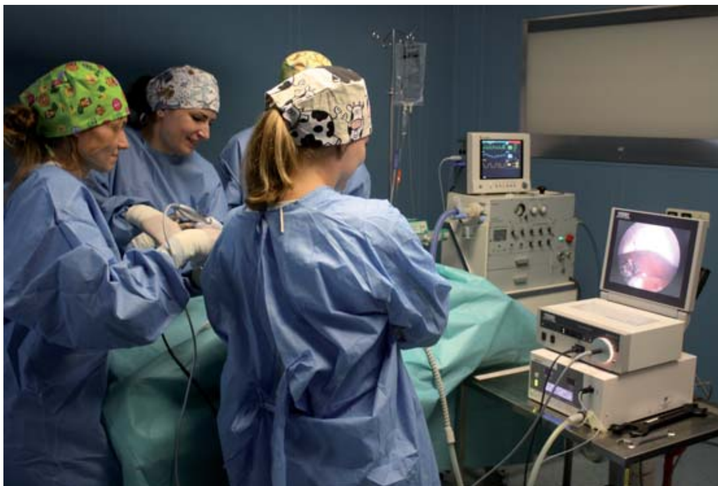
Praktická cvičení studentů veterinárního lékařství na sále v Pavilonu klinik malých zvířat

V kapitole Finance (kapitola 3) je popsán systém multizdrojového financování veterinárního vzdělávání na univerzitě a zahrnuje příjmy na vzdělávací činnost od státu, příjmy na vědecko-výzkumnou činnost (institucionální podpora výzkumným organizacím) od státu, příjmy na výzkumnou činnost studentů (specifický vysokoškolský výzkum) od státu, příjmy univerzity na grantový výzkum, na veterinární činnost a na výuku v anglickém studijním programu, příjmy od studentů