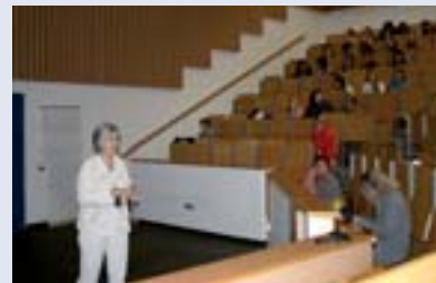
■ První přednáška se zaměřila na poruchy chování u psů

■ Vets for Pets neboli Zvěrolékaři pro domácí mazlíčky je název cyklu přednášek určených pro chovatelskou veřejnost domácích mazlíčků. První část cyklu zaměřená na nejlepšího přítele člověka proběhla pod názvem „Pes, člen rodiny a péče s ním spojená“ na Veterinární a farmaceutické univerzitě koncem června. Postupně se cyklus zaměří také na exotické ptáky, drobné savce, hady, plazy a jiná terarijní zvířata. Cyklus pořádá Institut celoživotního vzdělávání a informatiky.