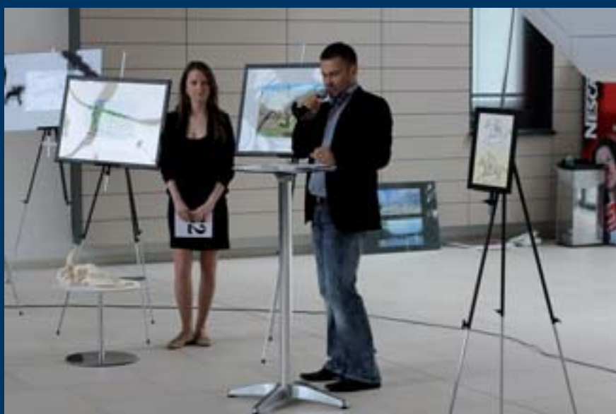
■ Dražily se obrazy, kosti ale také kalendář studentek veterinárních fakult