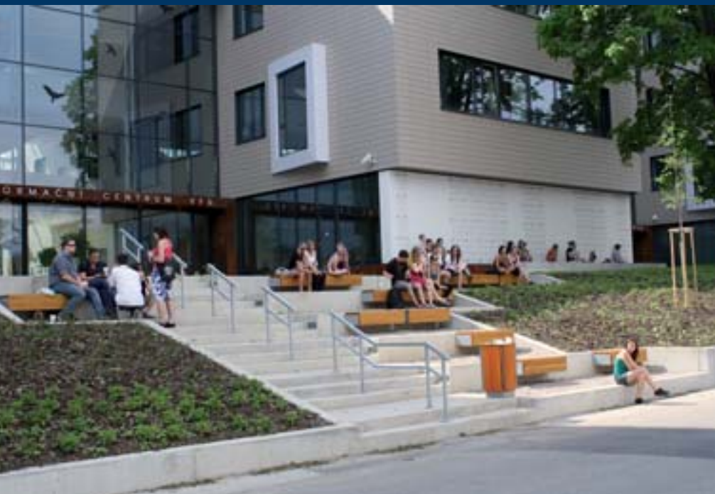
■ Studenti na lavičkách před Studijním a informačním centrem