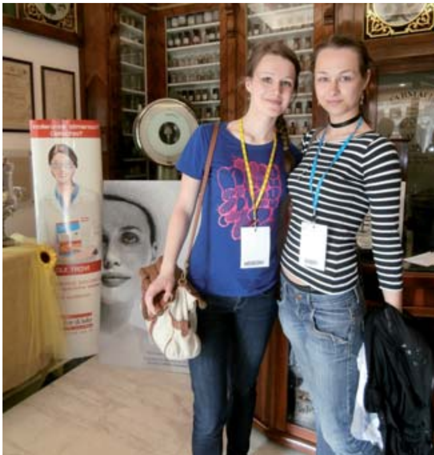
■ Část reprezentace Faf v Catanii

Paralelně s valnou hromadou probíhaly interaktivní trainingy a workshopy, kterých se studenti účastnili dle svých zájmů. V nabídce tak byl například workshop STELLA