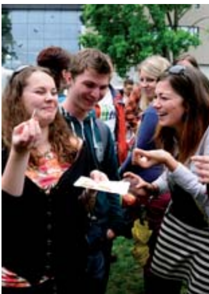
■ Na jídelničku nechyběli červi, sarančata ani švábi