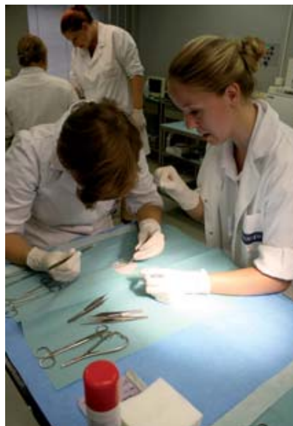
Cvičení z chirurgie na Klinice chorob ptáků, plazů a drobných savců

Druhá část kapitoly je zaměřena na postgraduální vzdělávání s akademickým zaměřením. V této části je popsáno vymezení systému a pravidel pro postgraduální vzdělávání – akademické zaměření, přijímání uchazečů, průběh studia (studijní program, oborová rada, školitel, indivi-