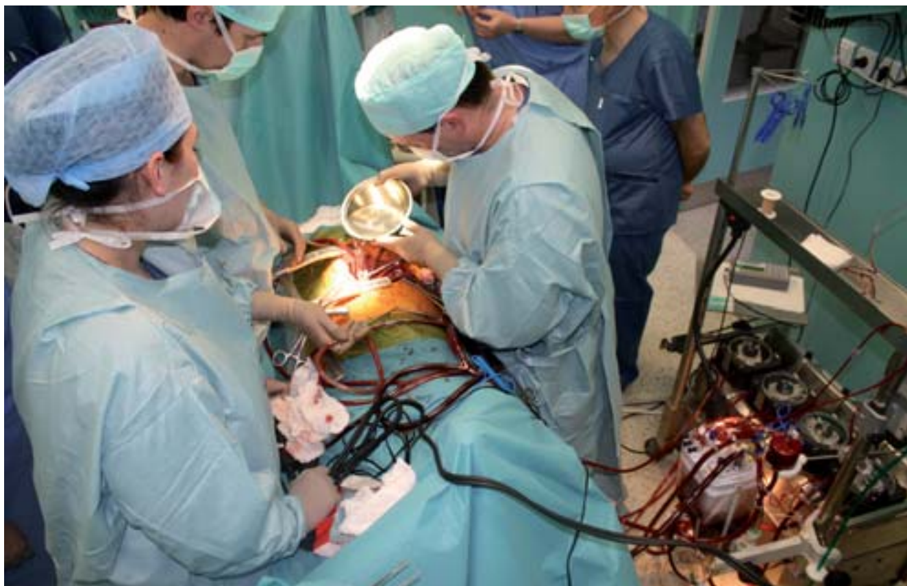
■ Mimotělní krevní oběh u prasete

V jednom z minulých čísel Vita Universitatis jsme informovali o tom, že VFU Brno spolupracuje v rámci projektu Mezinárodního centra klinického výzkumu (ICRC) s Fakultní nemocnicí U svaté Anny na transplantaci srdečních chlopní u lidí. Nové postupy transplantace srdečních chlopní ověřují specialisté z Oddělení chirurgie a ortopedie Kliniky chorob psů a koček společně s brněnskými kardiology na animálních modelech, konkrétně na prasatech v podmínkách experimentu. Podobný výzkum probíhá například v Londýně, kde se potýkají s vysokou mortalitou.