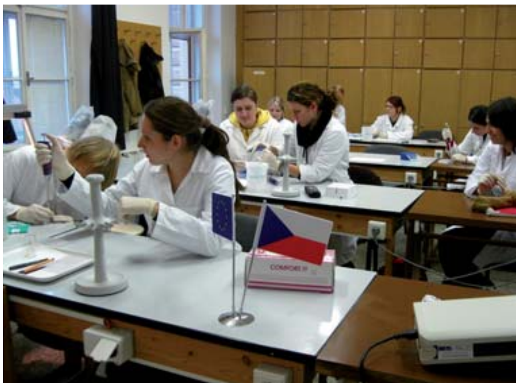
Pravidla a systém pregraduálního studia popisuje druhá kapitola selfevaluační zprávy

V kapitole Politika řízení kvality (kapitola 1) je popsána strategie zajišťování kvality na univerzitě. Tato strategie je popsána v základním strategickém dokumentu univerzity v Dlouhodobém záměru vzdělávací a vědecké, výzkumné, vývojové a inovační a další tvůrčí činnosti Veterinární a farmaceutické univerzity Brno na období 2011–2015 (DZ VFU Brno) a v dokumentu aktualizujícím záměry univerzity pro konkrétní rok Aktualizace DZ VFU Brno a v dokumentu určujícím roční ukazatele činnosti a kvality Institucionální rozvojový plán VFU Brno. Plnění této strategie a konkrétních záměrů a ukazatelů činnosti a kvality je realizováno na řídicí a rozhodovací úrovni uvnitř univerzity. Zajišťování kvality je v průběhu roku monitorováno, hodnoceno a dále ročně vyhodnocováno ve Výroční zprávě o činnosti univerzity. Při projednávání Výroční zprávy mohou být navrhována opatření k zvýšení zajišťování kvality na univerzitě. Kontrola zajišťování kvality na univerzitě veřejností je na úrov-