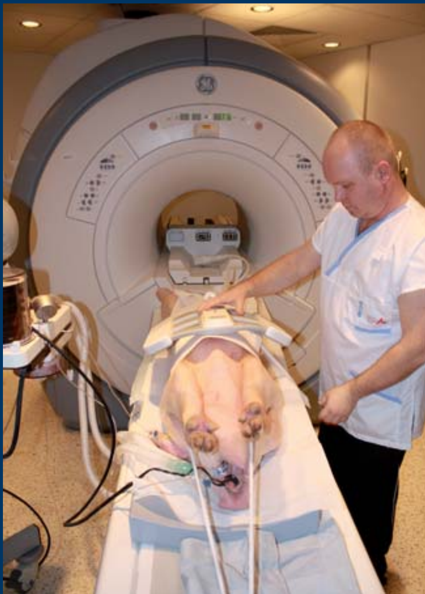
■ Využití magnetické rezonance v rámci projektu ICRC