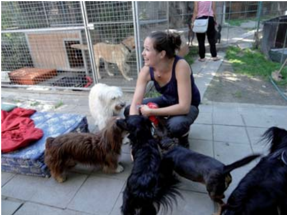
■ Studenti VFU navštívili 50 útulků po celé ČR

Útulek U Šmudliny v Tachově často bojuje se závažnými infekcemi. K zvládnutí situace však pracovníci útulku potřebují finance. Studenti VFU ukázali, že osudy opuštěných zvířat jim nejsou lhostejné, a rozhodli se pomoci zvířatům v tachovském útulku. V půlce května proto uspořádali benefiční závody autíček na dálkové ovládání. Každý soutěžící, který se zúčastní závodů, současně přispěje na chod útulku U Šmudliny. Závody se konaly 14. 5. ve foyer Studijního a informačního centra. Zúčastnit se mohl kaž-