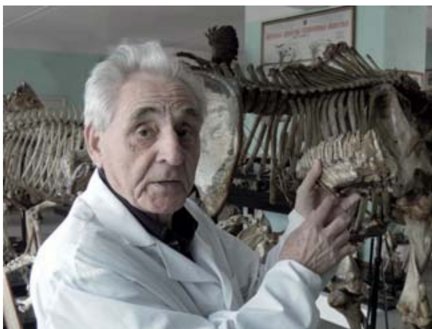
■ Zajímavost anatomického muzea – mamutí stolička