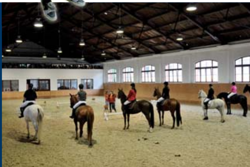
■ Program odstartoval v jízdárně sérií ukázek

IVSA se zřejmě letos vůbec rozhodla obohatit „kuchařskou“ část Majálesu. Kromě