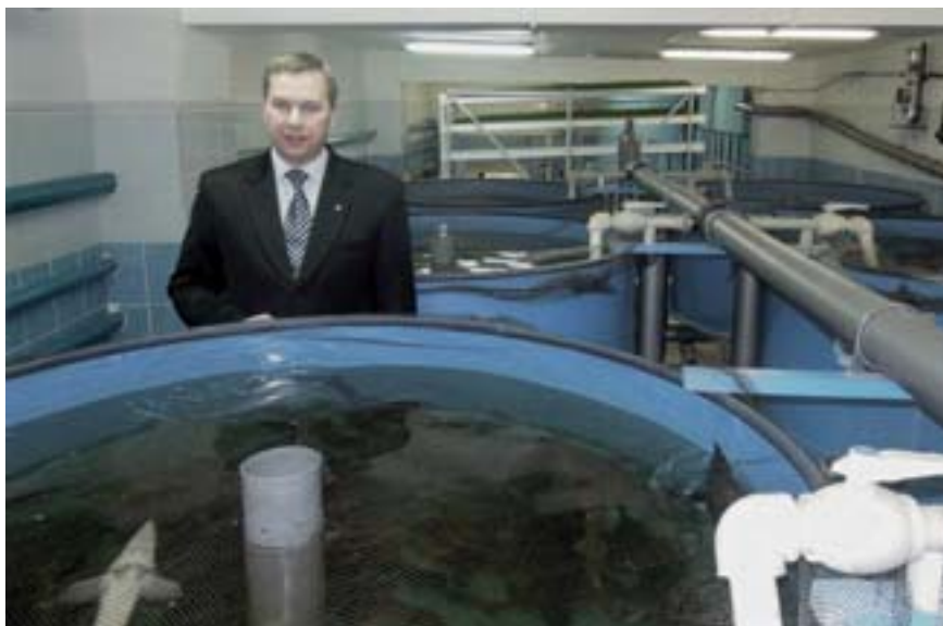
■ Fakulta se věnuje chovu a nemocem jeseterů

■ V červnu proběhla na jednotlivých fakultách VFU Brno přijímací řízení. Toho se zúčastnily dohromady téměř tři tisíce zájemců. Fakulta veterinárního lékařství pozvala 862 lidí, na Fakultu veterinární hygieny a ekologie se přihlásilo celkem 1 084 zájemců o studium, z toho 254 mělo zájem o studium nového studijního programu Ochrana zvířat a welfare. O studium na Farmaceutické fakultě mělo zájem 930 lidí. Podobně jako v předchozích letech převažují mezi uchazeči o studium na VFU Brno ženy.