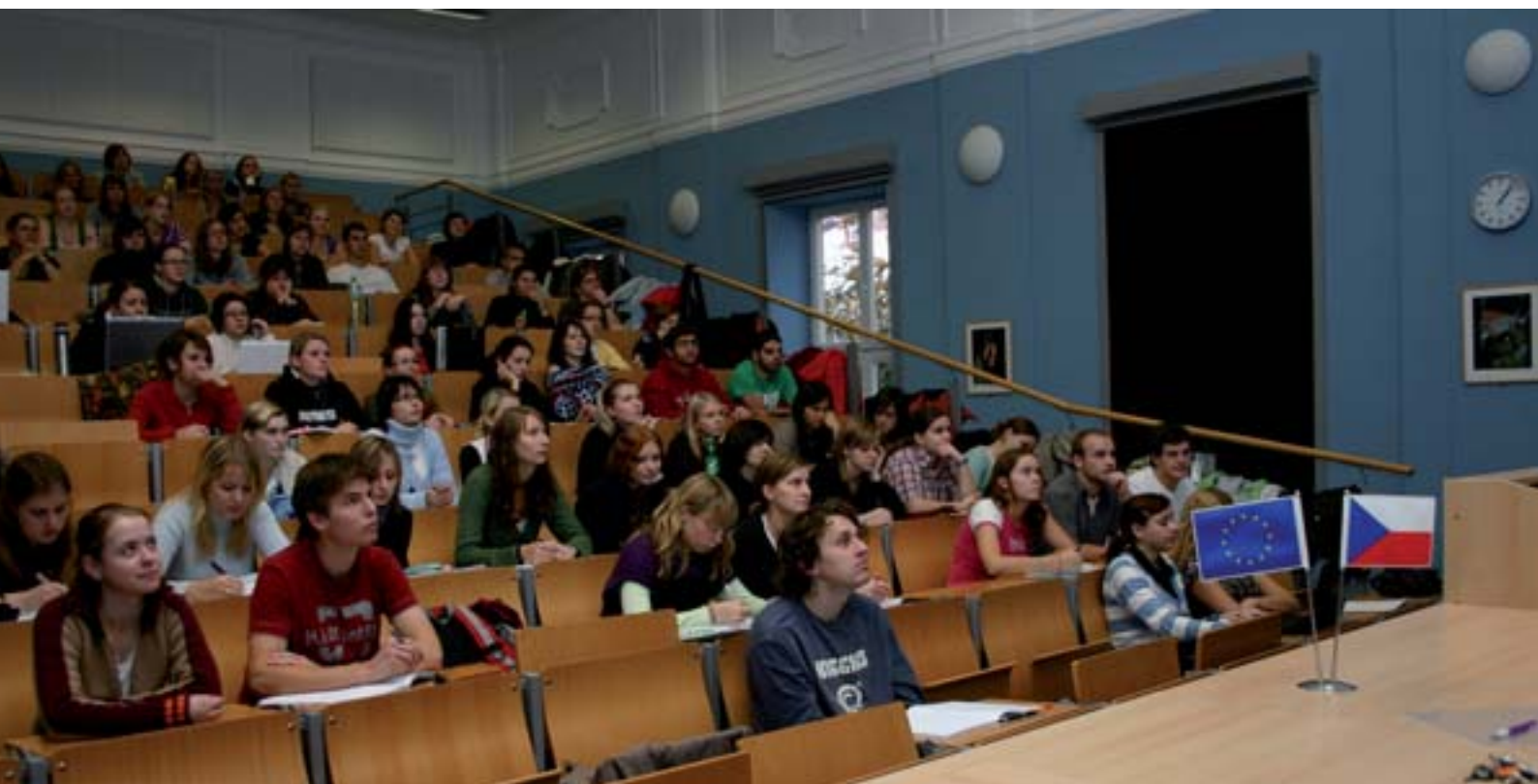
■ Zaplněná posluchárna Ústavu biologie a chorob volně žijících zvířat