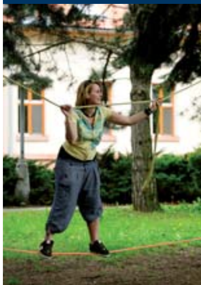
■ Atrakce lanového centra v centrálním parku VFU