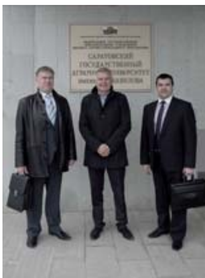
■ Děkan veterinární a potravinářské fakulty Saratov s děkanem FVHE

A proč ne? Je to přece horizont našich znalostí, poznávání.