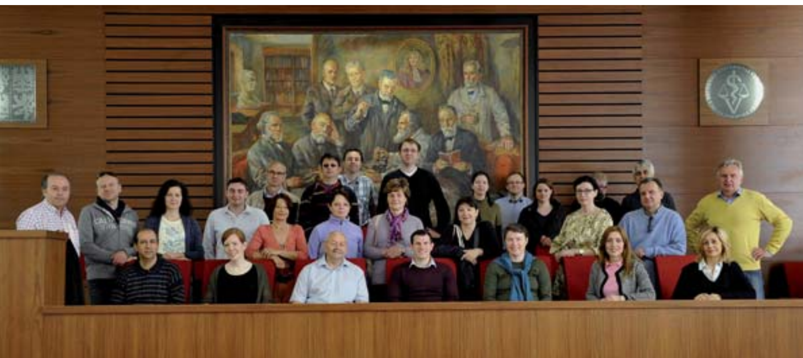
■ Účastníci BTSF v naší aule

■ text: Ladislav Steinhauer