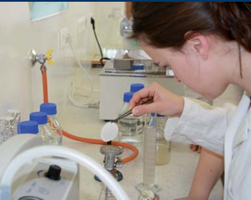
■ Cvičení v laboratoři mikrobiologie

tě. Jsou uvedeny počty učitelů, výzkumných pracovníků a ostatních vyučujících, a dále počty pracovníků personálu v péči o zvířata, v přípravě a zajišťování výuky, v administrativě a dalších podpůrných činnostech.