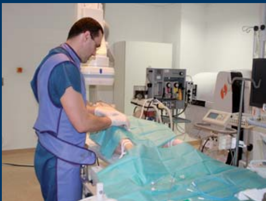
■ Výzkum v rámci ICRC probíhá ve spolupráci s humánními lékaři z Fakultní nemocnice u sv. Anny v Brně

duální studijní plán), zkušební systém, ukončení studia disertační prací a státní doktorskou zkouškou, udělení titulu PhD.