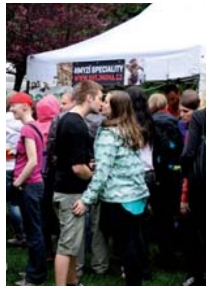
■ Máj je lásky čas