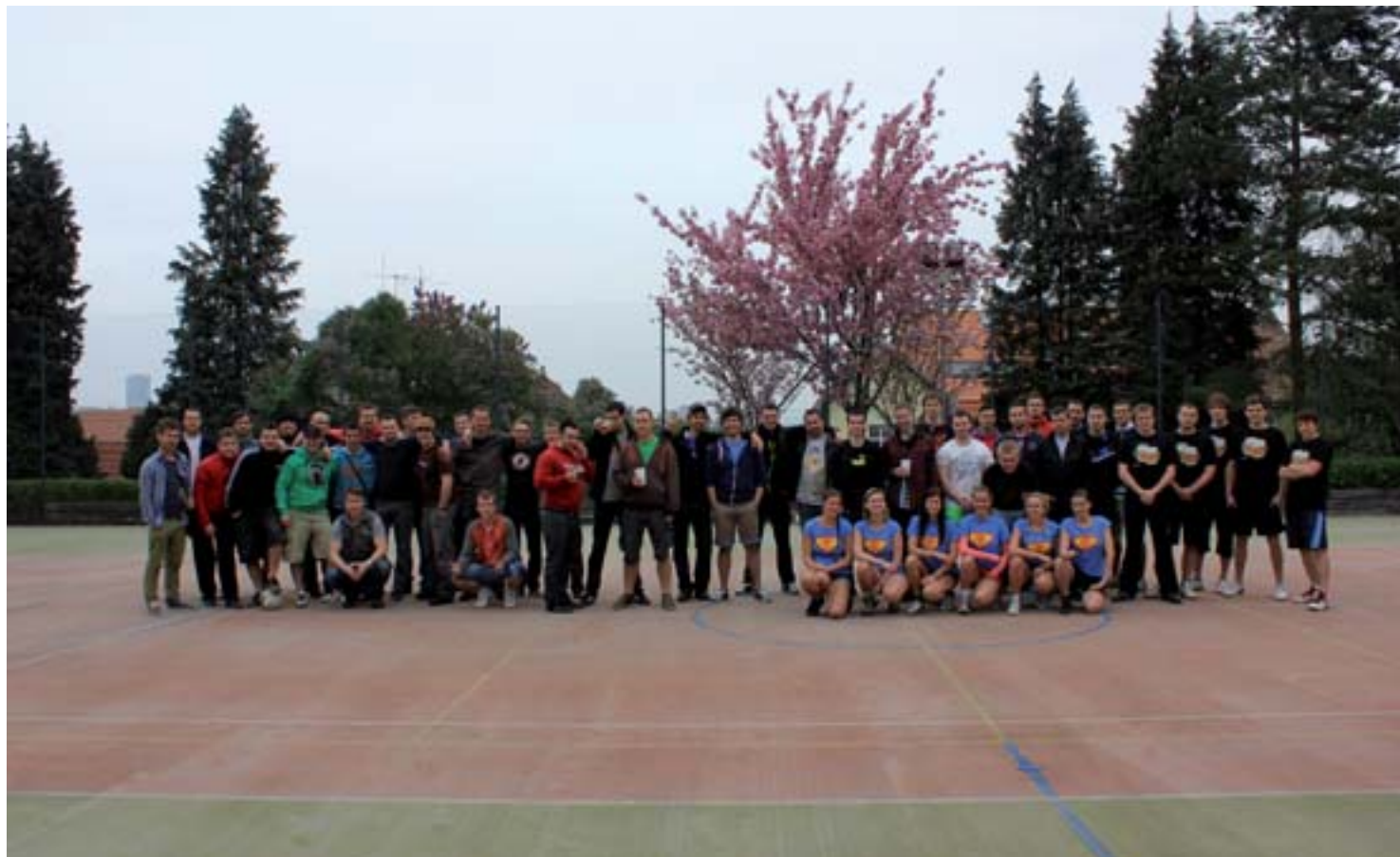
■ Společná fotka před turnajem