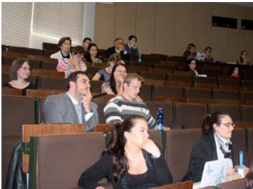
■ Květinův den je tradičním setkáváním mladých farmakologů