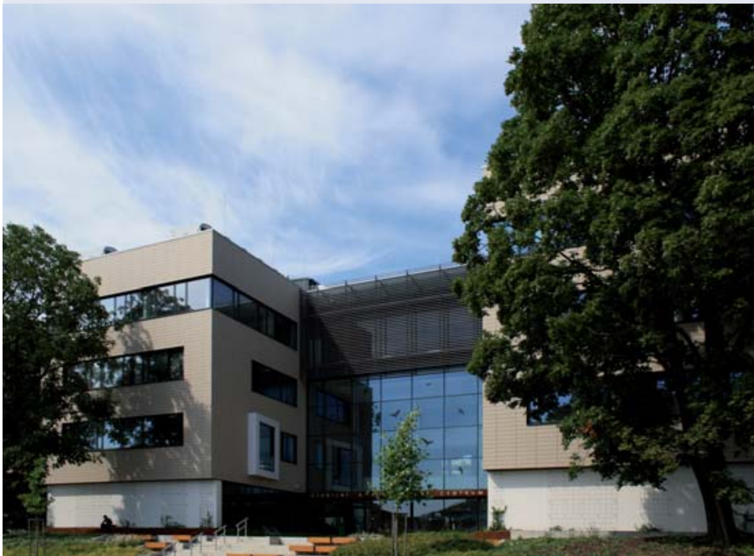
Budova studijního a informačního centra je dominantou areálu VFU Brno