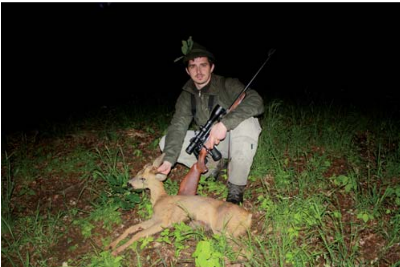
■ Krásný úlovek