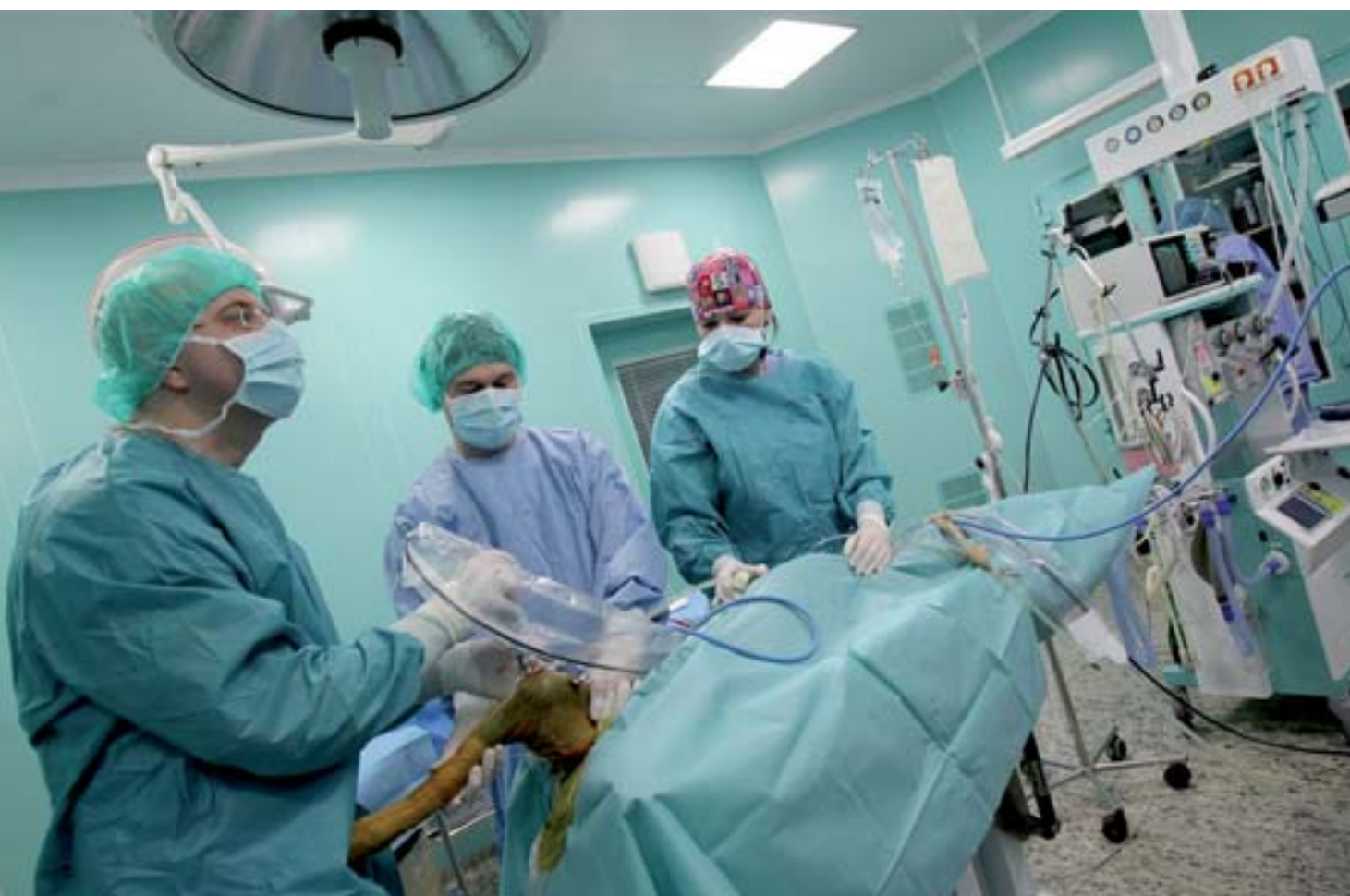
■ Domča podstoupila artroskopickou revizi kolenního kloubu a následnou osteotomii

„Fenka měla prasklý kolenní vaz. Pokud by dále zkoušela svého páníčka doprovázet, hrozilo by, že jí selže i přetěžo-