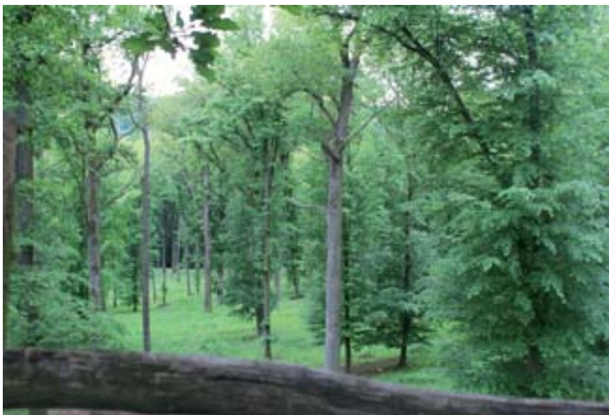
■ Posed nabízí dobrý rozhled na všechny strany

Srncí zvěř je krásná a ušlechtilá na pohled, hravá v bezstarostné mladosti, nedůvěřivě obezřetná ve stáří, elegantní v pohybu, urputná v teritoriálních bojích, něžná v době milostných her i statečná v období vyvádění mláďat. Je naší zvěří původní, stala se symbolem české krajiny a na rozdíl od mnoha jiných volně žijících