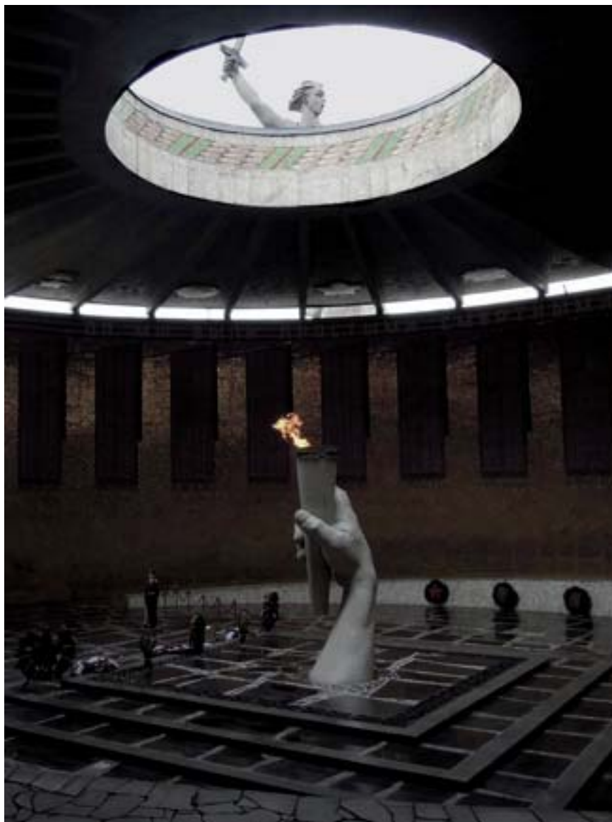
■ Matka Vlast vidí i na věčný oheň

V obrovském mauzoleu brouzdám ve sloupcích padlých obránců města. Jméno, hodnost. Tisíce jmen. Vybavují se mi lesy křížů v Normandii a u Verdunu. Drsné minulé století! Dva vojáci drží čestnou stráž. Atmosféru podtrhuje tiché Snění Roberta Schumanna. Je dobré si někdy přivstat. Školy, zájezdy, delegace sem vyšlapou až po desáté hodině. Cizinci? Téměř nikdo! Kdo by se kodrcal do Volgogradu? Město postavené v jednom socialistickém stylu, v mizerné rychlokvalitě, z jehož ulic je cítit to, co v našem bývalém pohraničí. Malá péče o to, co lidé dostali jen proto, že sem přišli.