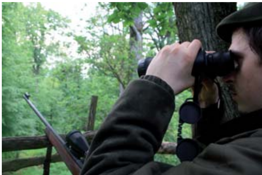
■ Bez dalekohledu to nemá cenu ani zkoušet

druhů se dokázala výborně přizpůsobit pochodům, které dramaticky změnily její životní prostředí během několika posledních desetiletí.