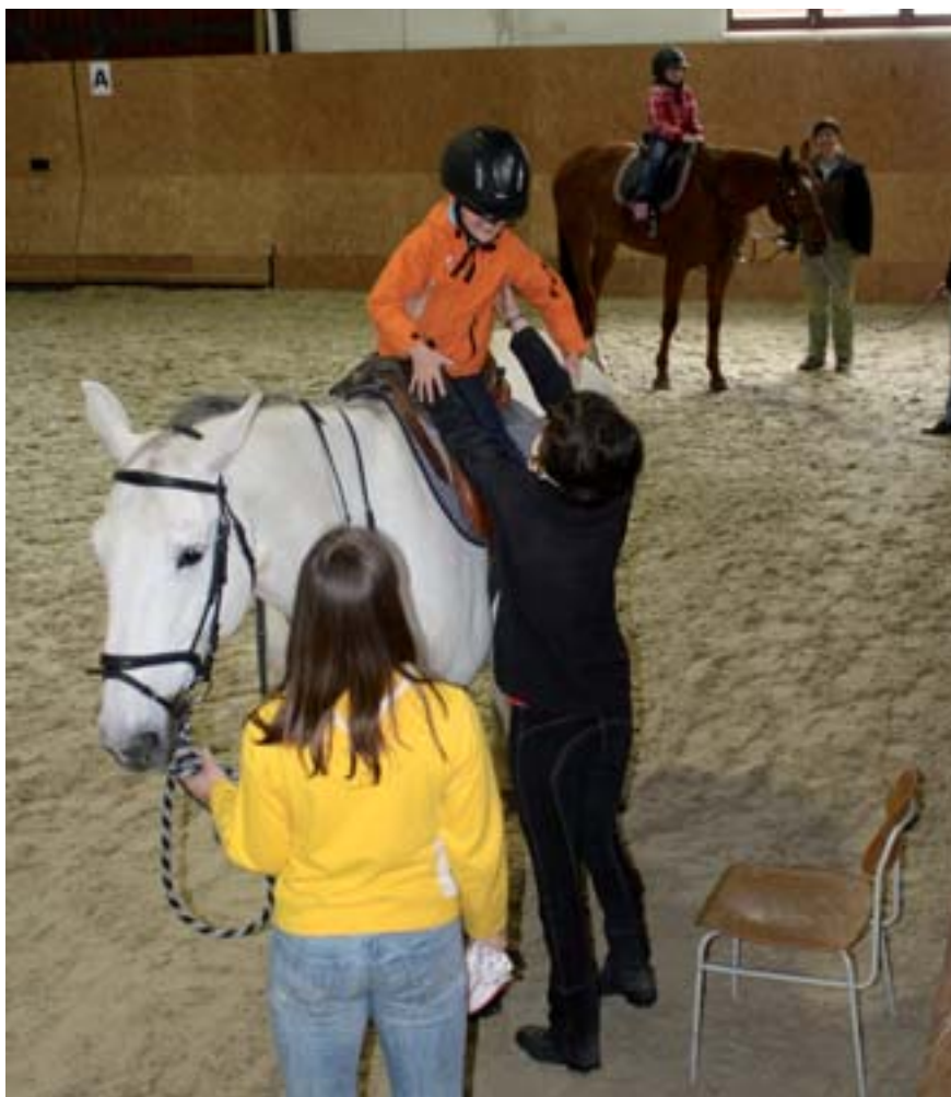
■ Projížďka na koni lákala ze všeho nejvíc

■ Vets for Pets neboli Zvěrolékaři pro domácí mazlíčky je název cyklu přednášek určených pro chovatelskou veřejnost domácích mazlíčků. První část cyklu zaměřená na nejlepšího přítele člověka proběhla pod názvem „Pes, člen rodiny a péče s ním spojená“ na Veterinární a farmaceutické univerzitě koncem června. Postupně se cyklus zaměří také na exotické ptáky, drobné savce, hady, plazy a jiná terarijní zvířata. Cyklus pořádá Institut celoživotního vzdělávání a informatiky.