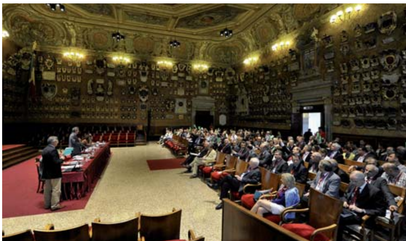
■ Hlavní část zasedání se uskutečnila ve Velké aule padovské univerzity